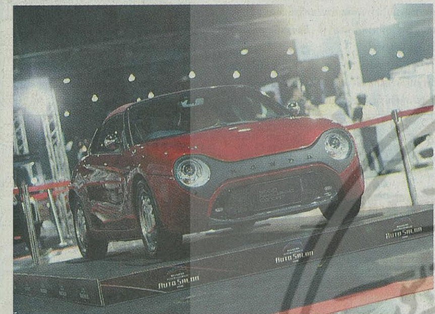
ฮอนด้า S660 NEO Classic Concept คันเล็ก น่ารัก แต่งตามเทลิอชขนาด

เพื่อกระตุ้นยอดขาย และเชิญชวนให้ มีผู้เดินเลือกสินค้าในงานมากที่สุด ผู้จัดงานได้ เตรียมของรางวัลมูลค่ากว่า 3 ล้านบาท แจก เป็นโปรโมชันมากมาย ไม่ว่าจะเป็นชุดพิเศษ สุนทรยนต์ซูซูกิ สวิฟท์ รุ่นลิมิเต็ด อิดิชั่น ตกแต่งพิเศษด้วยอุปกรณ์ชั้นนำรวมมูลค่ากว่า 7 แสนบาท สามารถร่วมลุ้นโชคใหญ่กันได้ โดย ชื้อบัตรเข้าชมงานมูลค่า 100 บาท รวมถึงไปโปรโมชันสินค้าราคาพิเศษ ถือเป็นส่วนเวลาที่