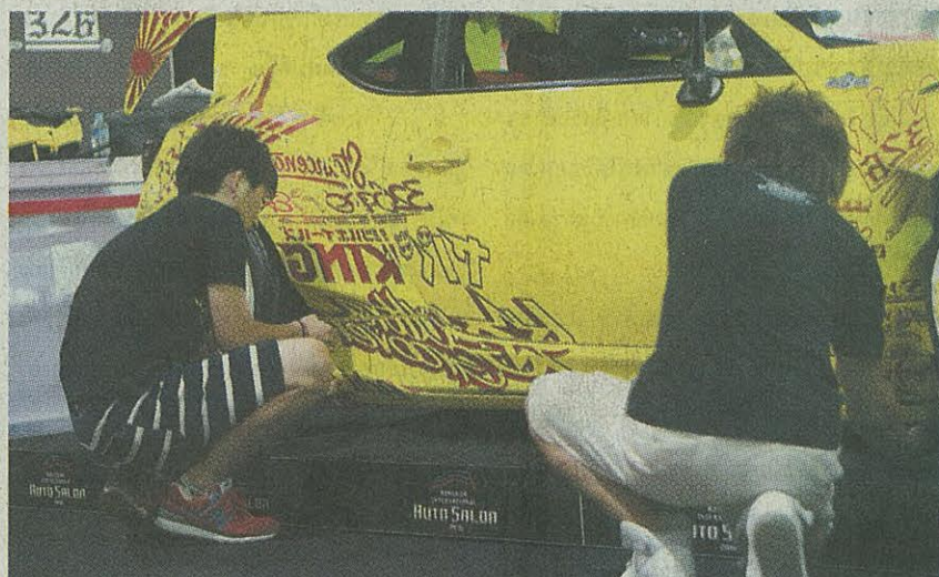
ทีมงานช่างจากญี่ปุ่นเซตรถให้พร้อม ก่อนงาน Bangkok International Auto Salon 2016

ประเทศญี่ปุ่นตลอดทั้ง 5 วันของการจัดงาน ตั้งแต่ 22-26 มิถุนายน ณ อาคารชาเลนเจอร์ ฮอลล์ 2-3 อิมแพ็ค เมืองทองธานี ด้วยพื้นที่ การแสดงงานกว่า 40,000 ตารางเมตร