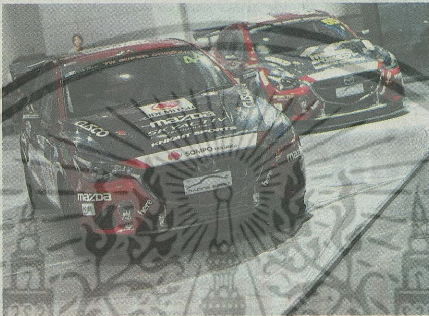
บูมมาสด้าเตรียมรถสวยๆ ให้จอยชม