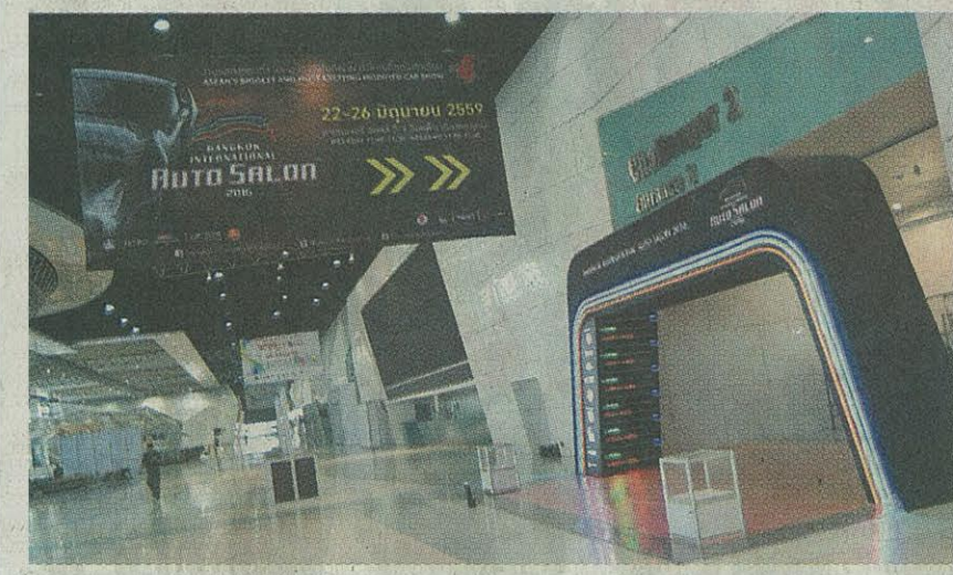
Bangkok International Auto Salon 2016 เปิดฉากให้แฟนฯ คนรักรถแต่งได้เข้ามาเลือก ชมและซื้อสินค้าแล้ว ระหว่าง 22-26 มิ.ย.นี้