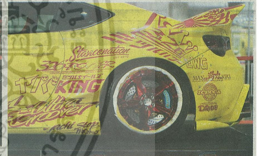
แค่ด้านข้างก็กินชาติสำหรับ TOYOTA 86 คันนี้