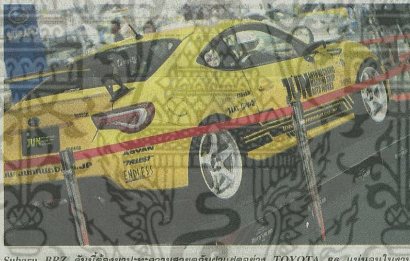
Subaru BRZ คันนี้ต้องมาปะทะความสวยดูกับฝาแฝดอย่าง TOYOTA 86 แน่นนอนในงาน บางกอก อินเตอร์เนชั่นแนล ออโต ซาลอน 2016 ที่อาคารชาเลนเจอร์ อิมแพ็ค เมืองทองธานี