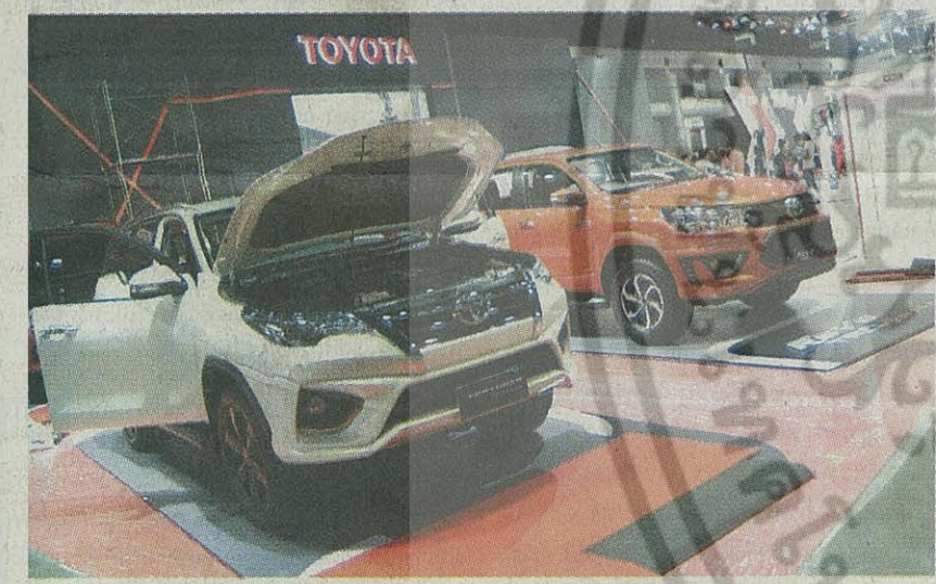
โดยตำนำรถยนต์นำของค่ายพร้อมให้คนรักรถโตชมและจับจองกันอย่างแน่นนอน