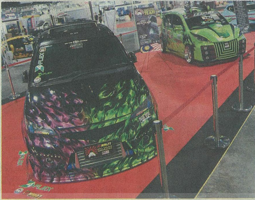
รถแต่งจากสำนักชื่อของมาเลเซีย ก็นำรถมาโชว์ในงานแสดงรถแต่งที่ยิ่งใหญ่ที่สุดในอาเซียน Bangkok International Auto Salon 2016

"บางกอก อินเตอร์เนชั่นแนล ออโต ซาลอน ครั้งที่ 4" หนึ่งปีมีครั้งเดียว ที่งานรถแต่ง อุปกรณ์โมดิฟาย ยิ่งใหญ่ที่สุดแห่งอาเซียน ที่บอวลไปด้วยความบันเทิงเต็มรูปแบบ มอบความสุขอย่างเต็มอิ่มให้แก่ผู้เดินเลือกสินค้า จะกลับมายังครั้งอย่างเต็มรูปแบบ เชิญพบกับรถยนต์แต่งพิเศษ สุดยอดเยี่ยมสุดเมด ที่สำนักแต่งชั้นนำของญี่ปุ่น ลงแรงสร้างสรรคให้เป็นหนึ่งเดียวของโลก ผ่านรางวัลจากงานโตเกียว ออโต ซาลอน ประเทศญี่ปุ่น จำนวน 8 คัน ร่วมแสดงเพื่อเป็นแม่แบบแห่งการตกแต่งรถยนต์ ขณะเดียวกัน บริษัทผู้ผลิตรถยนต์แบรนด์หลักภายในประเทศได้นำรถยนต์รุ่นแต่งพิเศษ และอุปกรณ์แต่งพิเศษของรถยนต์แต่ละรุ่นมาจำหน่ายภายใต้โปรแกรมพิเศษ ลดกระหน้า แถมด้วยแคมเปญพิเศษเพื่อให้สามารถเลือกสรรรถยนต์ที่ต้องการได้เต็มที่ ไม่ว่าจะเป็นโตโยต้า, ซูซูกิ, อิซูซุ, มาสด้า, นิสสัน, ฮอนด้า, บีเอ็มดับเบิลยู, เอ็มจี, มินิ, ซูบารุ และเมอร์เซเดส เบนซ์, นำเข้ารถยนต์รุ่นแต่งพิเศษ ตลอดจนรุ่นลิมิเต็ด อิดิชั่น จากทั่วโลก รวมทั้งรถจักรยานยนต์ ยามาฮ่า, เบนลีสี่, ซูซูกิ มาจำหน่ายด้วยการจัดโปรโมชั่นพิเศษเพื่อให้ผู้ซื้อได้เลือกสรรรถยนต์ รถจักรยานยนต์ และพิเศษที่นำมาแสดงและจำหน่ายรวมแล้วเป็นจำนวนเกือบ 1,000 คัน