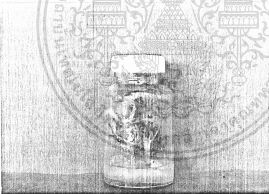
ภาพที่ 2 แสดงลักษณะของต้นแตงโมที่อวบน้ำ มีใบหนาเล็กสีเขียวเข้มเป็นมัน

เอกสารนี้เป็นเอกสารที่สงวนไว้สำหรับการใช้งานเพื่อการศึกษาเท่านั้น ไม่อนุญาตให้นำไปใช้ประโยชน์ด้านการค้า ไม่ว่ากรณีใดๆ ทั้งสิ้น อีกทั้งห้ามมิให้ดัดแปลงเนื้อหา และต้องอ้างอิงถึงเจ้าของเอกสารทุกครั้งที่มีการนำไปใช้