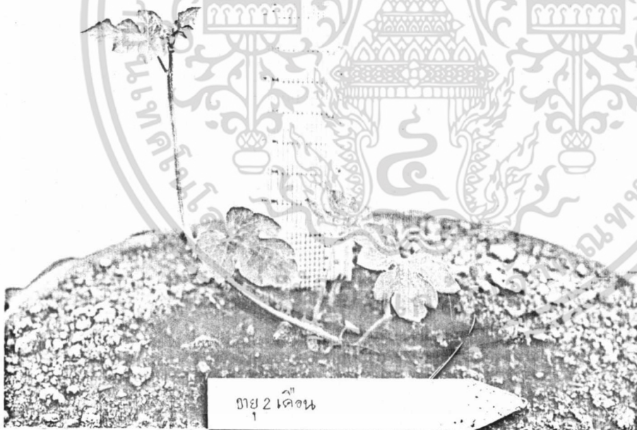
ภาพที่ 4 แสดงลักษณะการเจริญเติบโตของแตงโมเมื่ออายุ 2 เดือนหลังจากย้ายออกปลูก

เอกสารนี้เป็นเอกสารที่สงวนไว้สำหรับการใช้งานเพื่อการศึกษาเท่านั้น ไม่อนุญาตให้นำไปใช้ประโยชน์ด้านการค้า ไม่ว่าจะกรณีใดๆ ทั้งสิ้น อีกทั้งห้ามมิให้ดัดแปลงเนื้อหา และต้องอ้างอิงถึงเจ้าของเอกสารทุกครั้งที่มีการนำไปใช้