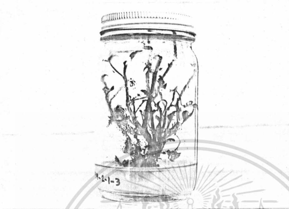
ภาพที่ 3 แสดงลักษณะของต้นแตงโมที่เป็นกอ มีใบมาก