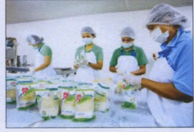
“โคโค เฟรช” มะพร้าวน้ำหอมพร้อมกิน