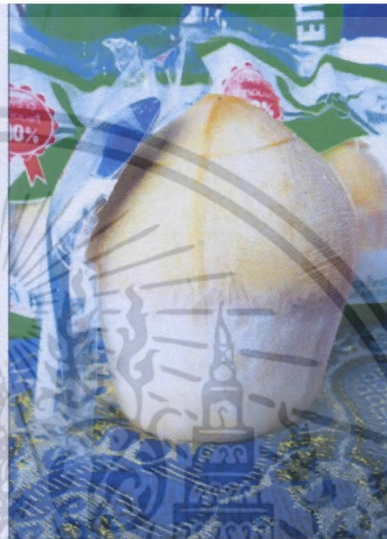
มีชิ้นและตลอด มาให้ด้วย