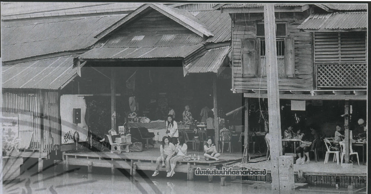
ที่นั่งเล่นรับน้ำที่ตลาดหัวตะเข้