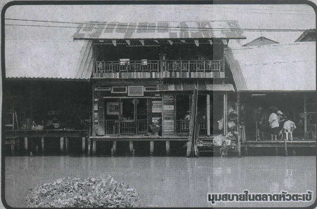
มุมสวยในตลาดหัวตะเข้