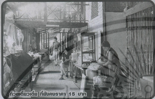
ก๊วยเตี่ยวเตี่ยว ที่ยังคงราคา 15 บาท