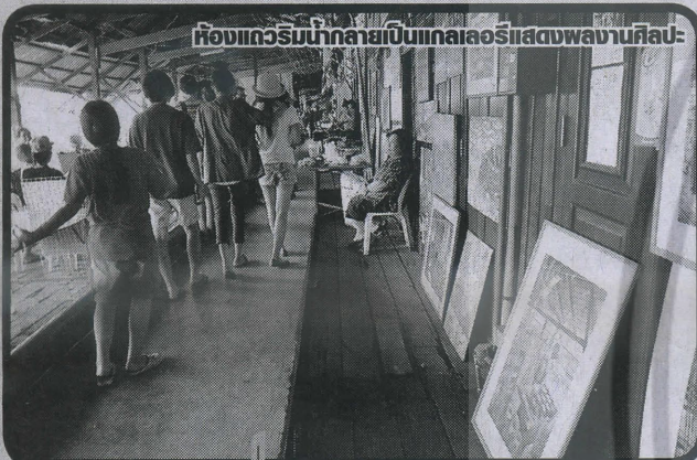
ห้องแกลอรีบ้านกลายเป็นแกลลอรีแสดงผลงานศิลปะ