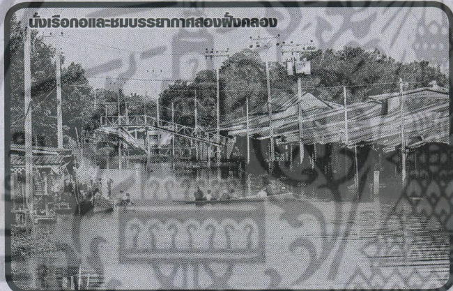
บ้านเรือกอลและชมบรรยากาศสองฝั่งคลอง