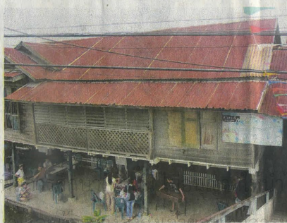
ตลาดนัดศิลปะ