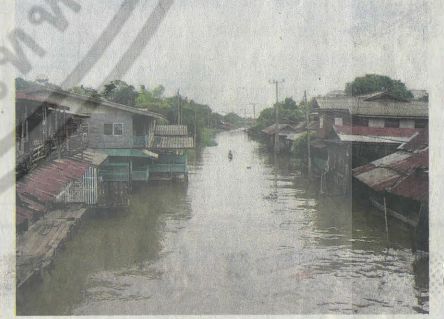
เรือนไม้สองฝั่งคลอง

แต่เป็นการให้คนรุ่นหลังเห็นคุณค่าและรักชุมชนของตนเอง เมื่อตลาดมีชีวิต ก็เสมือนได้เติมเต็มความสุขให้คนในชุมชนด้วยเช่นกัน