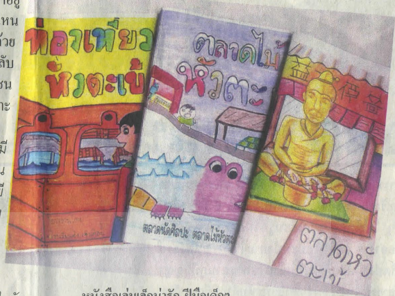
หนังสือเล่มเล็กน่ารักฝีมือเด็กๆ

ป้าอ้อยบอกว่า “ตลาดน้ำหัวตะเข้มีต้นทุนค่อนข้างดี เพราะติดกับสถานศึกษาสองแห่ง คือสถาบันเทคโนโลยีพระจอมเกล้าเจ้าคุณทหารลาดกระบัง และวิทยาลัยช่างศิลป์ ซึ่งเดินเรื่องงานศิลปะ ได้เข้ามามีส่วนร่วมช่วยกันฟื้นฟูตลาด โดยนำศิลปะแขนงต่างๆ มาไว้ที่ตลาดน้ำหัวตะเข้ เกิดตลาดนัดศิลปะในวันเสาร์-อาทิตย์ เป็นแหล่งเรียนรู้ของกลุ่มนักเรียน นักศึกษา และประชาชนทั่วไป ได้