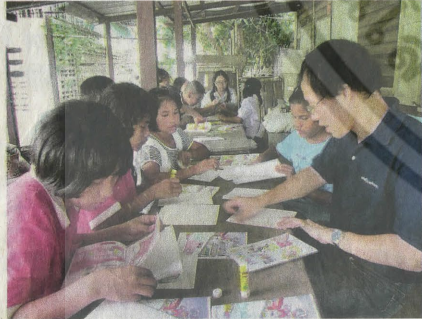
ช่วยกันเข้าเล่มหนังสือ

ชีวิต บอกเล่าความรุ่งเรืองทางเศรษฐกิจ คนไทยเชื้อสายจีนส่วนใหญ่นับถือบูชาเทพเจ้าชาง มีการต่อเรือใช้สัญจรทางการเกษตรขนาดใหญ่ เมื่อการคมนาคมทางถนนสะดวกขึ้น การขนส่งทางน้ำลดลง ตลาดก็ซบเซา ประกอบกับเมื่อปี 2541 เกิดไฟไหม้ด้านหนึ่งของตลาด ทำให้ตลาดน้ำค่อยๆ หายไป มีแค่บางร้านที่ยังเปิดขายของเด็กๆ น้อยๆ