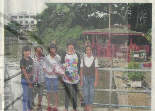
เด็กๆ พาชม 'ตลาดหัวตะเข้' สถานที่สำคัญของชุมชน

แวะมาเดินเล่น ชื้อของ และเยี่ยมชมงานศิลปะ”