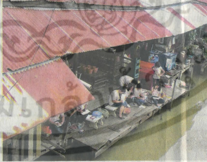
แหล่งเรียนรู้ของกลุ่มนักเรียนนักศึกษา

เมื่อไม่สามารถค้าขายทำมาหากินได้เหมือนแต่ก่อน หลายคน