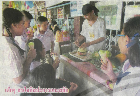
เด็กๆ สนใจเลือกอาหารทะเลสด

ในประเทศไทยยุคที่ยังไม่มีถนนใช้ในการคมนาคมขนส่งเป็นหลัก “ตลาดน้ำ” คือแหล่งค้าขายสำคัญของชุมชน ผู้คนต่างเดินทางล่องเรือมาเพื่อซื้อขายสินค้า บ่งบอกถึงความรุ่งเรืองใน