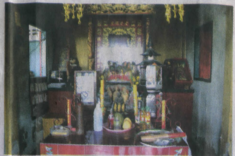
ชมหัวและหางจรเข้ได้ที่ศาลเจ้าพ่อหัวตะเข้