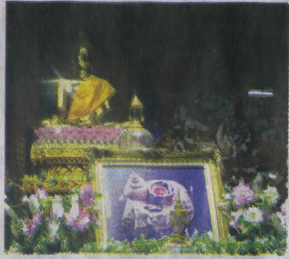
สักการะพระบรมสารีริกธาตุได้ที่ วัดปลุกศรีธา