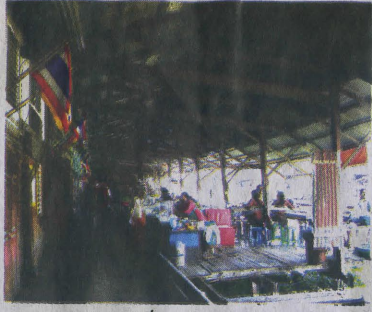
ตลาดเก่าหัวตะเข้ที่ค่อนข้างเงียบเหงา