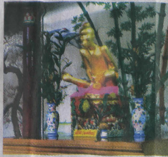
หุ่นองค์เขียนที่เรือเจฮงเต๋ว