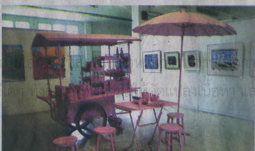
ชมงานศิลปะหลากหลายแนวที่หอศิลป์วิทยาลัยช่างศิลป์ลาดกระบัง