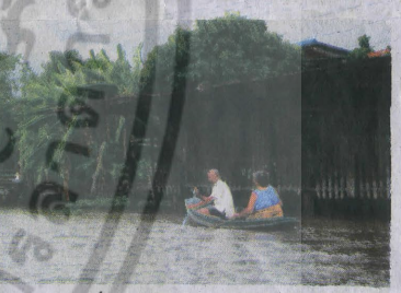
ภาพวิถีชีวิตที่พบเห็นได้ริมคลอง

แวะเข้าไปที่ "เรือเจฮงเต๋ว" ซึ่งมีองค์เขียน หรือพระโขนงสี่แฉก ซึ่งเมื่อร้อยกว่าปีก่อนท่านได้เดินทางมาจากเมืองจีนมาพำนักอยู่ในแถบลาดกระบังนี้ ท่านเป็นผู้ยึดมั่นในหลักธรรมคำสั่งสอนของพระพุทธเจ้าด้วยการถือศีลกินเจ สวดมนต์ภาวนาอยู่ในโรงเจแห่งนี้จนได้ฌานสมาบัติ ละสังขารไปในขณะกำลังนั่งสมาธิอยู่ ร่างที่ไม่เก่าเปื่อยของท่านยังคงมีผู้มาเคารพกราบไหว้กันที่โรงเจแห่งนี้