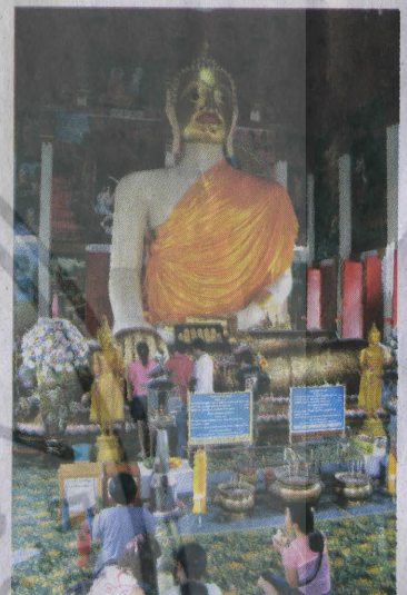
หลวงพ่อขาว วัดลาดกระบัง

เมื่อเดินกลับออกมาที่ตลาดเก่าริมน้ำ และข้ามสะพานไปยังอีกฝั่งคลองแล้วเดินต่อมาอีกหน่อยก็จะเห็นความคึกคักของตลาดหัวตะเข้ใหม่ได้ โดยที่ตลาดบริเวณนี้ก็มีทั้งตลาดสด ร้านอาหาร และร้านขายของกินของใช้ต่างๆ เหมือนตลาดทั่วไป อยาลืม