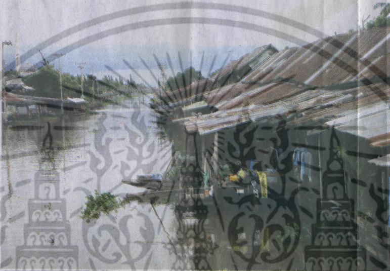
บรรยากาศริมคลองประเวศบุรีรัมย์

ประเวศบุรีรัมย์ และต่อมายังได้ขุดคลองแยกจากคลองประเวศบุรีรัมย์อีก 4 คลอง คือ คลองหนึ่ง คลองสอง คลองสาม และคลองสี่