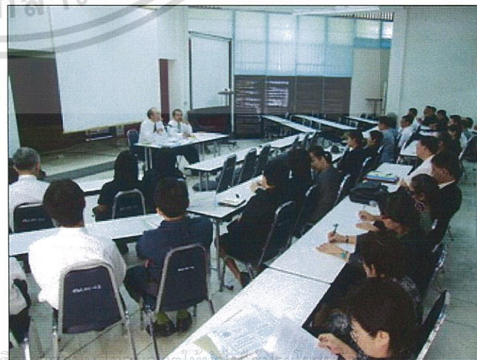
ไม่ว่ากรณีใดๆ ทั้งสิ้น อีกทั้งห้ามมิให้ตัดแปลงเนื้อหา และต้องอ้างอิงถึงเจ้าของเอกสารทุกครั้งที่มีการนำไปใช้