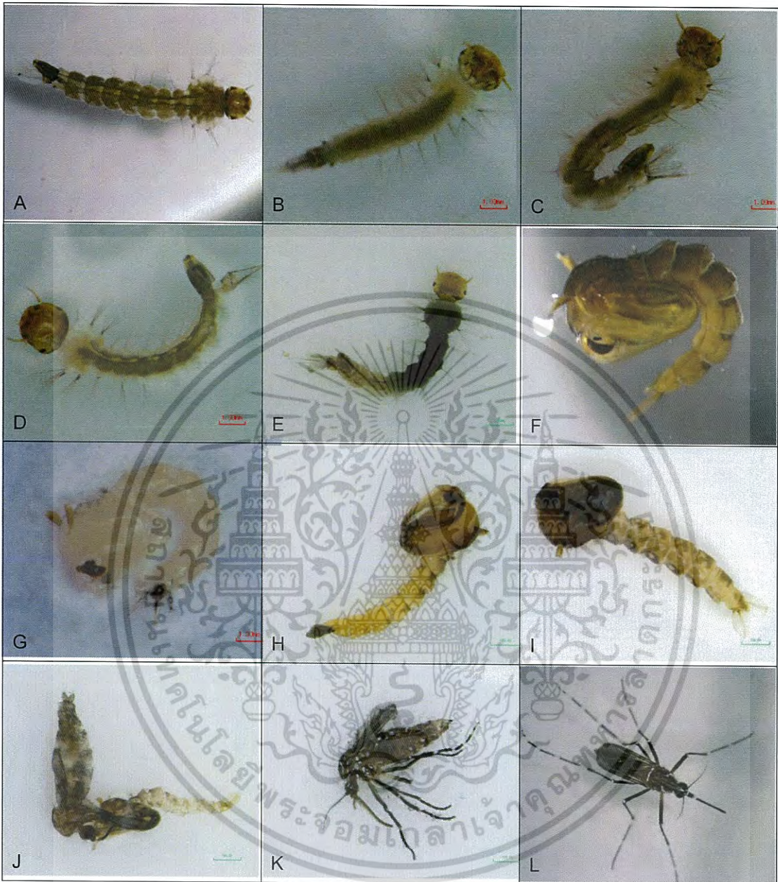
Figure 4.2 Morphogenetic abnormalities of Aedes aegypti by four essential oils Morphological aberrations of larvae Aedes aegypti after treatment with essential oils A shows normal larvae of Ae. aegypti (NL), B-E shows death occurred during the larval stage with deformed larvae (DL), F shows dead normal brown pupa (BP), G-I shows deformed pupa (DF), J shows partially emerged and tarsi deformed (PA), K shows malformed adult (MA), L= normal adult (NA)

เอกสารนี้เป็นเอกสารที่สงวนไว้สำหรับการใช้งานเพื่อการศึกษาเท่านั้น ไม่อนุญาตให้นำไปใช้ประโยชน์ด้านการค้า ไม่ว่าจะกรณีใดๆ ทั้งสิ้น อีกทั้งห้ามมิให้ตัดแปลงเนื้อหา และต้องอ้างอิงถึงเจ้าของเอกสารทุกครั้งที่มีการนำไปใช้