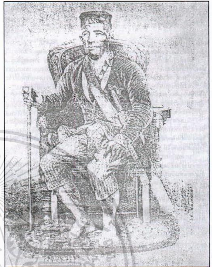
สมเด็จพระจอมเกล้าเจ้าอยู่หัว

แต่ความกลัวของคนบางพวกยังยิ่งขึ้นไปกว่านี้ ถึงหลีกเลี่ยงดังว่ามานี้แล้ว ก็ยังมีความหวาดระแวงว่า ตัวตั้งอยู่ในที่ใกล้แห่งความตายยังพรันพรียงว่าอันตรายแห่งชีวิตจะมีมา ยังคิดหาเครื่องกันความตาย แลทางหลีกเลี่ยงอย่างอื่นอีกมาก คนที่พรรณนาแต่การทั้งปวงนั้นไม่อาจที่จะเห็นจริงพร้อมกันได้”