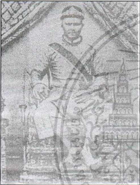
กรมพระราชวังบวรวิชัยชาญ ในรัชกาลที่ 4

เพราะฉะนั้น ขอท่านผู้ทรงมีปัญญา จงรีบ ร้อนชวนขวยประพาศการบุญการกุศลเป็นความ สุจริตให้มากด้วยกายวาจา แลใจโดยเป็นการเร็ว