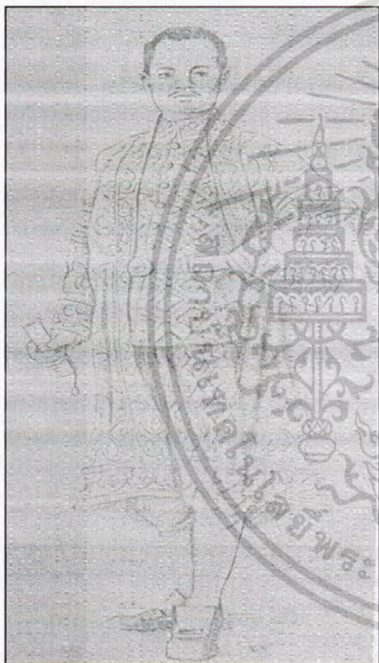
ขุนนางผู้ใหญ่ในแผ่นดินสมเด็จพระจอมเกล้าฯ

วิธีก้าวหน้าในด้านการเมืองนั้นสมัยโบราณกับสมัยปัจจุบันนี้ แท้จริงก็คงไม่ผิดกันเท่าไร การให้สินบนหรือคอร์รัปชันนั้น ไม่ใช่วิธีการสมัยใหม่ แต่ทำกันมาแล้วตั้งแต่โบราณ