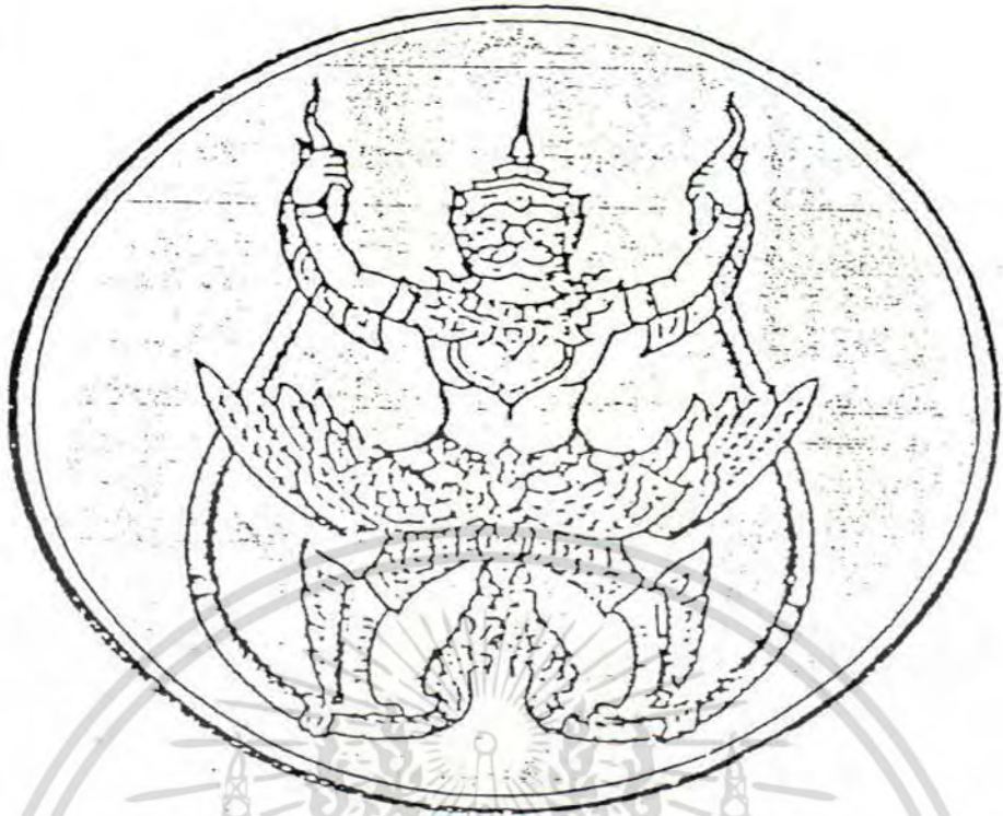
พระราชลัญจกรสำหรับแผ่นดินและประจำพระองค์รัชกาลที่ ๒