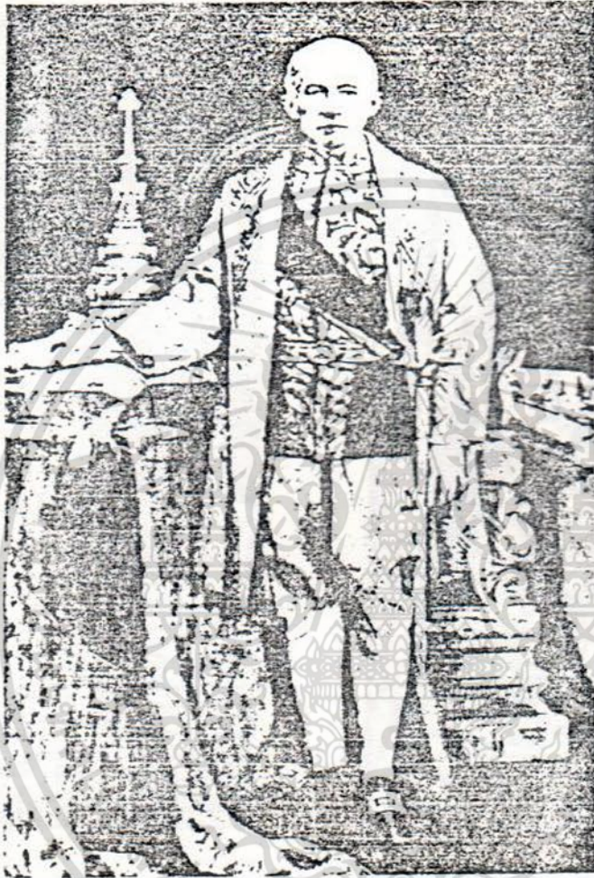
พระบาทสมเด็จพระจอมเกล้าเจ้าอยู่หัว

เอกสารนี้เป็นเอกสารที่สงวนไว้สำหรับการใช้งานเพื่อการศึกษาเท่านั้น ไม่อนุญาตให้นำไปใช้ประโยชน์ด้านการค้า ไม่ว่ากรณีใดๆ ทั้งสิ้น อีกทั้งห้ามมิให้ดัดแปลงเนื้อหา และต้องอ้างอิงถึงเจ้าของเอกสารทุกครั้งที่มีการนำไปใช้