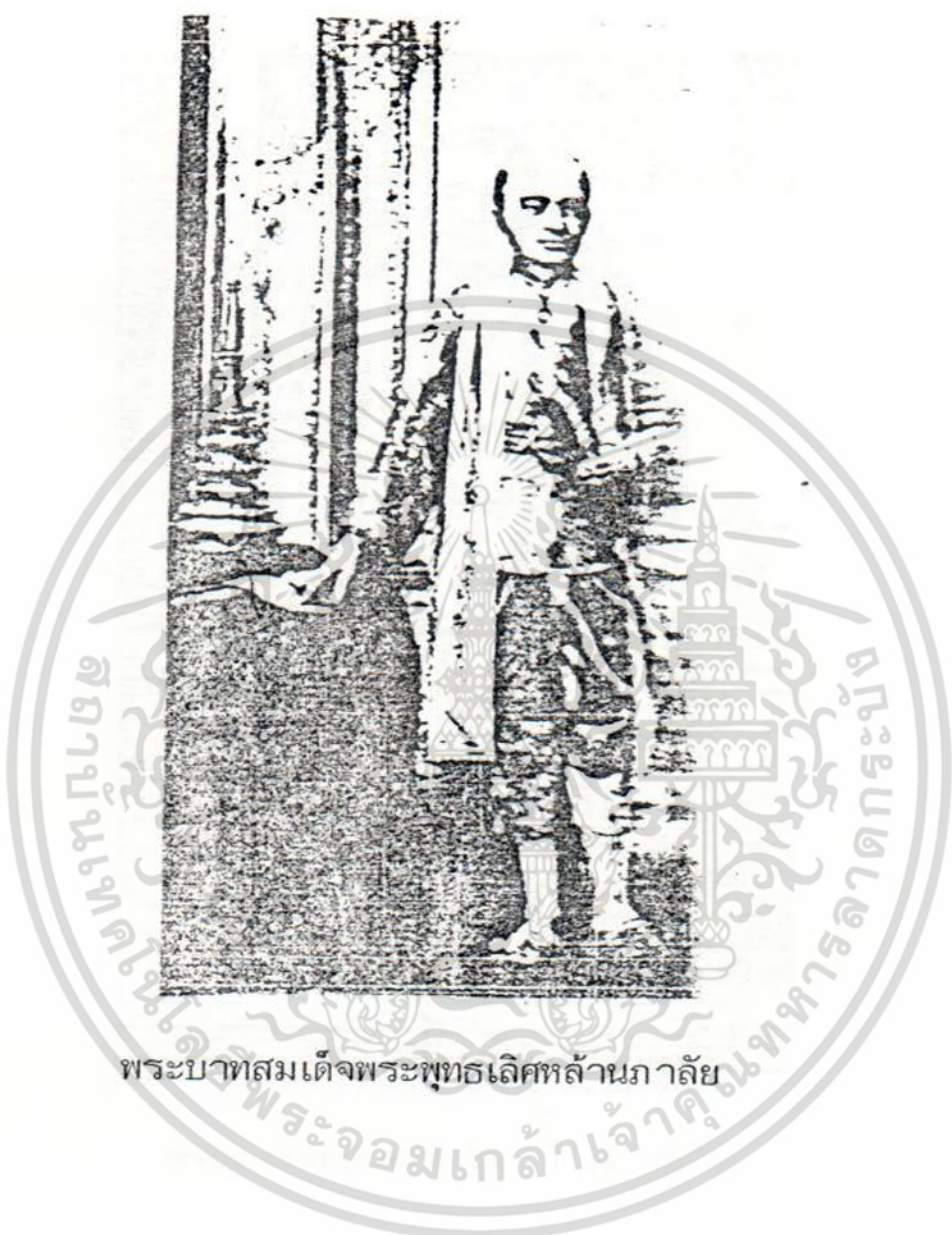
พระบาทสมเด็จพระพุทธเลิศหล้านภาลัย

เอกสารนี้เป็นเอกสารที่สงวนไว้สำหรับการใช้งานเพื่อการศึกษาเท่านั้น ไม่อนุญาตให้นำไปใช้ประโยชน์ด้านการค้า ไม่ว่ากรณีใดๆ ทั้งสิ้น อีกทั้งห้ามมิให้ดัดแปลงเนื้อหา และต้องอ้างอิงถึงเจ้าของเอกสารทุกครั้งที่มีการนำไปใช้