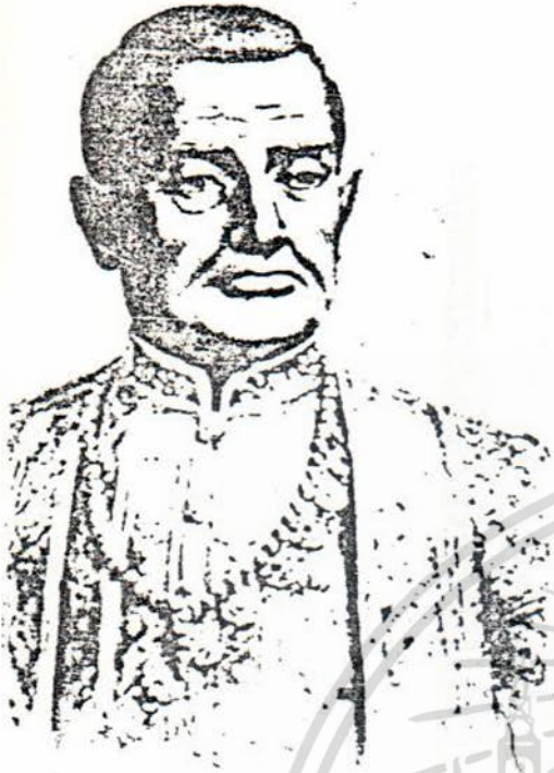
พระบาทสมเด็จพระพุทธยอดฟ้าจุฬาโลกมหาราช