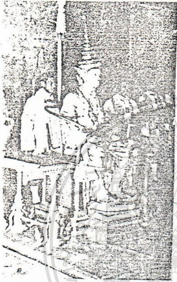
พระบาทสมเด็จพระปกเกล้าเจ้าอยู่หัว