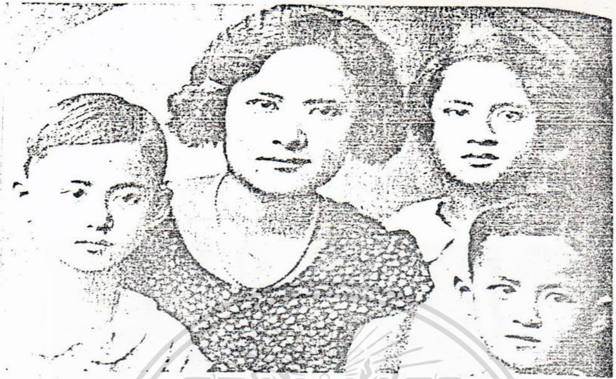
พระองค์เจ้าอานันทมหิดล (ซ้าย) ผู้ได้รับเสนอพระนามเลือกเป็นพระมหากษัตริย์