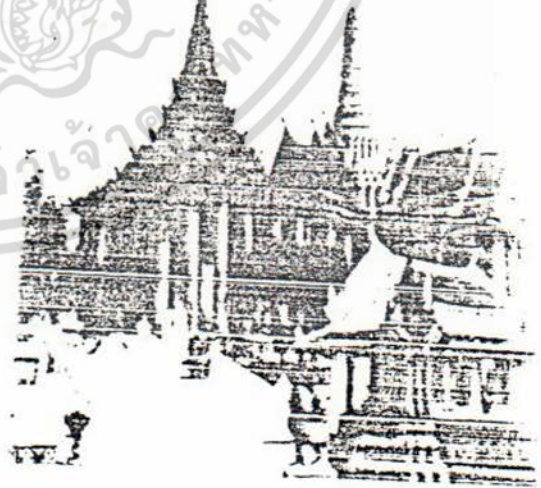
ปราสาทพระเทพมิตร

เอกสารนี้เป็นเอกสารที่สงวนไว้สำหรับการใช้งานเพื่อการศึกษาเท่านั้น ไม่อนุญาตให้นำไปใช้ประโยชน์ด้านการค้า ไม่ว่ากรณีใดๆ ทั้งสิ้น อีกทั้งห้ามมิให้ดัดแปลงเนื้อหา และต้องอ้างอิงถึงเจ้าของเอกสารทุกครั้งที่มีการนำไปใช้