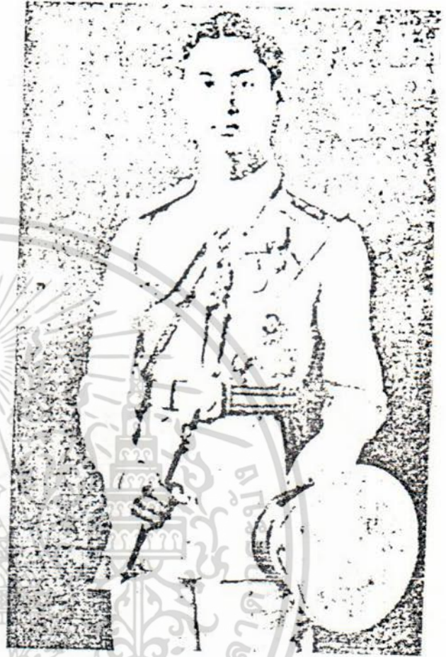
พระบาทสมเด็จพระเจ้าอยู่หัวอานันทมหิดล

เอกสารนี้เป็นเอกสารที่สงวนไว้สำหรับการใช้งานเพื่อการศึกษาเท่านั้น ไม่อนุญาตให้นำไปใช้ประโยชน์ด้านการค้า ไม่ว่ากรณีใดๆ ทั้งสิ้น อีกทั้งห้ามมิให้ตัดแปลงเนื้อหา และต้องอ้างอิงถึงเจ้าของเอกสารทุกครั้งที่มีการนำไปใช้