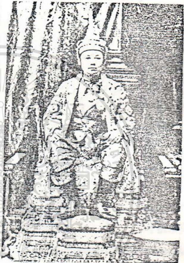
พระบาทสมเด็จพระจุลจอมเกล้าเจ้าอยู่หัว