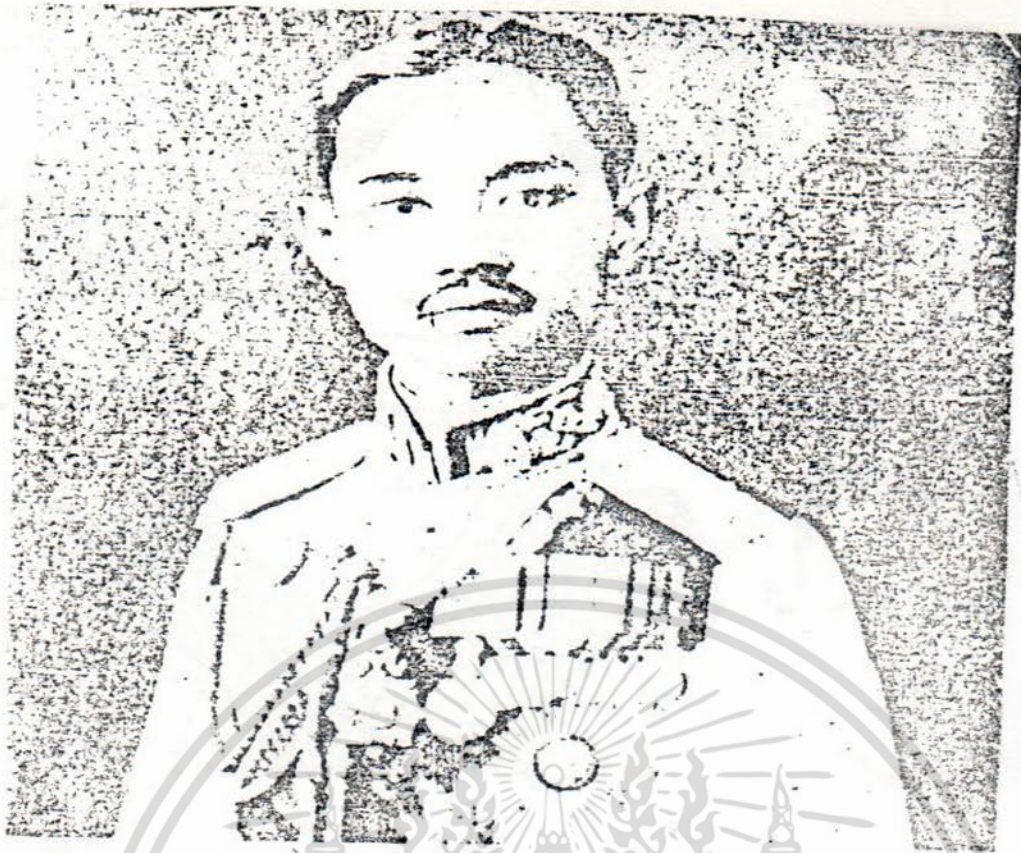
ร.7 ทรงยอมรับการเปลี่ยนแปลงการปกครองเป็นพระมหากษัตริย์ภายใต้รัฐธรรมนูญเป็นพระองค์แรก