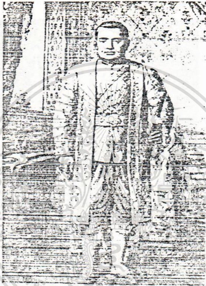
พระบาทสมเด็จพระนั่งเกล้าเจ้าอยู่หัว

เอกสารนี้เป็นเอกสารที่สงวนไว้สำหรับการใช้งานเพื่อการศึกษาเท่านั้น ไม่อนุญาตให้นำไปใช้ประโยชน์ด้านการค้า ไม่ว่ากรณีใดๆ ทั้งสิ้น อีกทั้งห้ามมิให้ดัดแปลงเนื้อหา และต้องอ้างอิงถึงเจ้าของเอกสารทุกครั้งที่มีการนำไปใช้