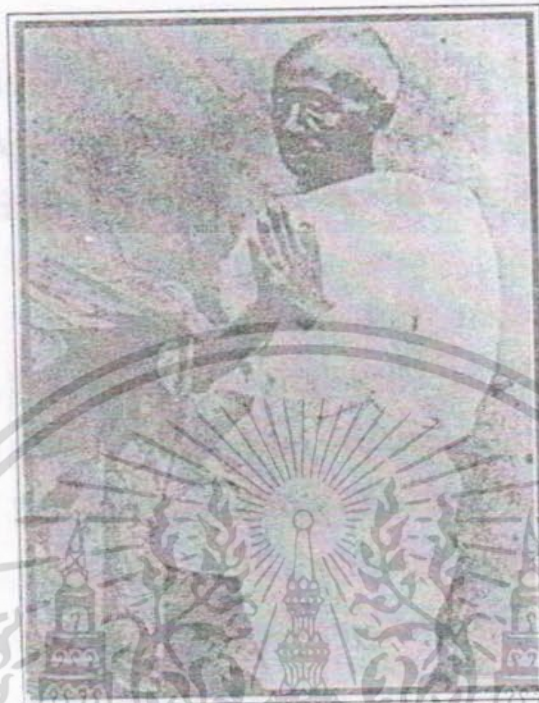
พระบาทสมเด็จพระจอมเกล้าเจ้าอยู่หัว ทรงเสด็จ

เป็นราชประเพณี สืบมาแต่สมัยรัชกาลที่ ๔ เจ้านายในราชสำนัก มักทรงภูษาแดงในวันพระ การสวดพระอภิธรรมนิยมปฏิบัติกันมา