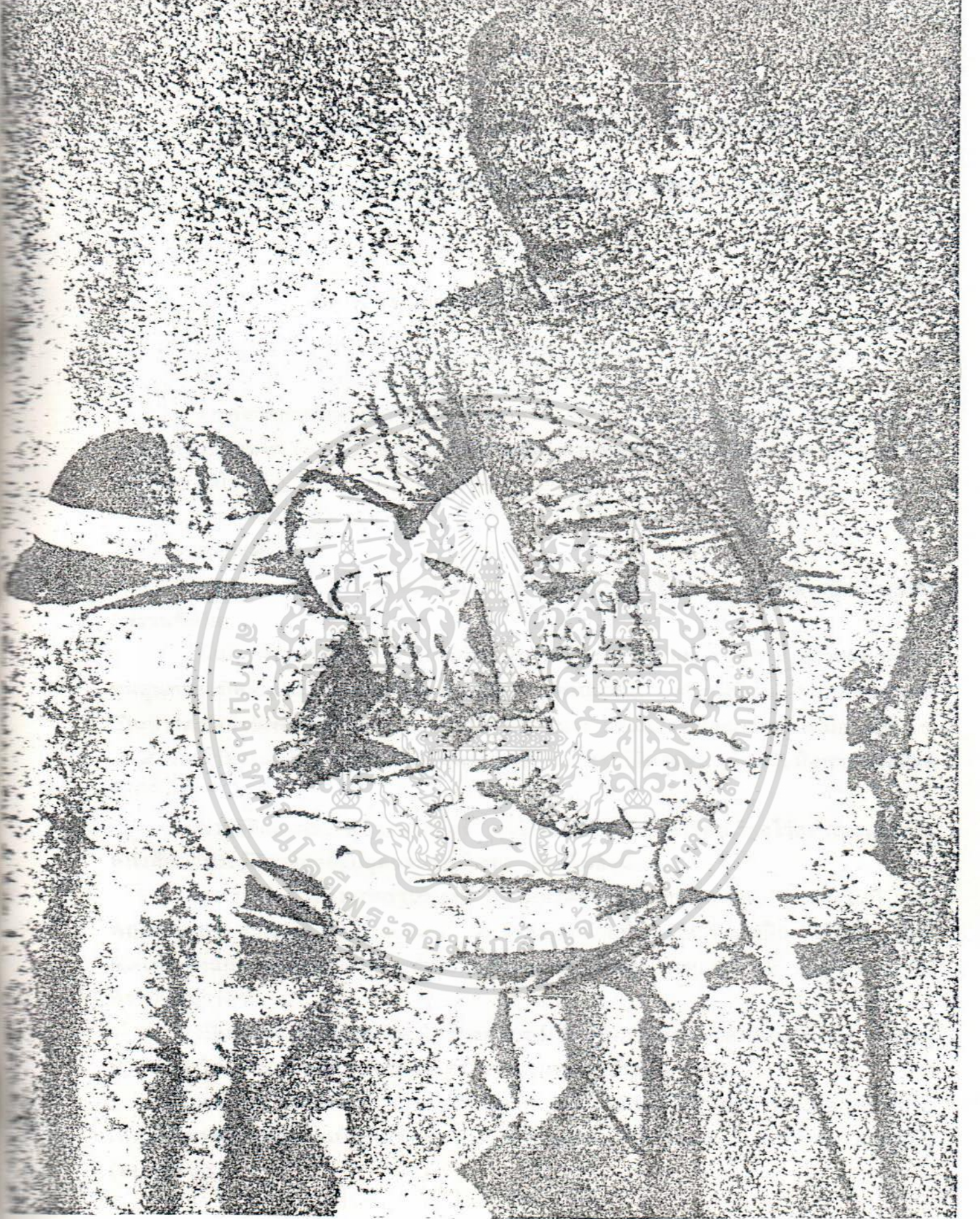
หลวงอัคนีนฤมิตร (จิตร จิรราคนี) ช่างถ่ายรูปอาชีพคนแรกของไทย เอกสารนี้เป็นเอกสารที่สงวนเวลาหรือบริการใช้งานเพื่อการศึกษาเท่านั้น ไม่นับญาติเห็นาเป็เซ็ประโยชน์ด้านการค้า ถ่ายประมาณระหว่าง พ.ศ. 2412-2422 ไม่ว่ากรณีใดๆ ทั้งสิ้น อีกทั้งห้ามมิให้ดัดแปลงเนื้อหา และต้องอ้างอิงถึงเจ้าของเอกสารทุกครั้งที่มีการนำไปใช้