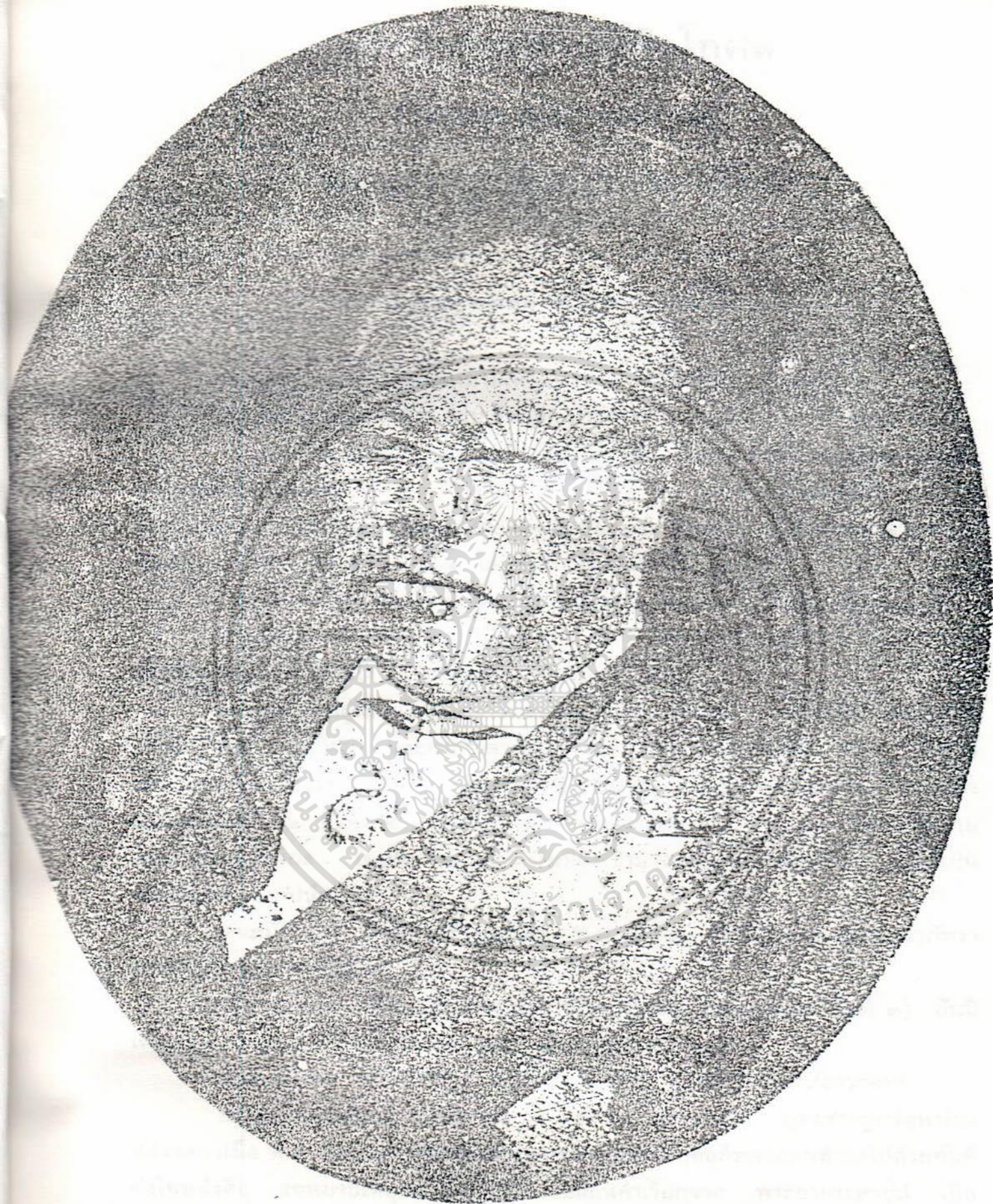
พระยากระสาพนักษิณโกศล (โหมต อมาตย์กุล) ข้างถ่ายรูปยุคแรกของไทย การค้า เอกสารนี้เป็นเอกสารที่สงวนลิขสิทธิ์ไว้เพื่อการค้าเท่านั้น ไม่อนุญาตให้ ถ่ายซ้ำ พ.ศ. 2416 หรือหลังจากนั้นไม่ว่า ไม่ว่ากรณีใดๆ ทั้งสิ้น อีกทั้งห้ามเผยแพร่ลงเนื้อหา และต้องอ้างอิงถึงเจ้าของเอกสารทุกครั้งที่มีการนำไปใช้