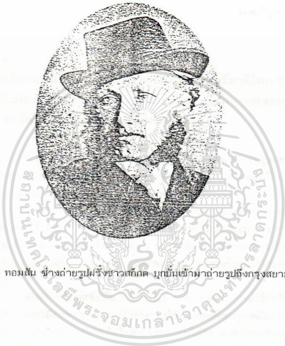
นายจอห์น ทอมสัน ช่างถ่ายรูปฝรั่งชาวสก๊อต มุกมันเข้ามาถ่ายรูปถึงกรุงสยาม

เอกสารนี้เป็นเอกสารที่สงวนไว้สำหรับการใช้งานเพื่อการศึกษาเท่านั้น ไม่อนุญาตให้นำไปใช้ประโยชน์ด้านการค้า ไม่ว่ากรณีใดๆ ทั้งสิ้น อีกทั้งห้ามมิให้ดัดแปลงเนื้อหา และต้องอ้างอิงถึงเจ้าของเอกสารทุกครั้งที่มีการนำไปใช้