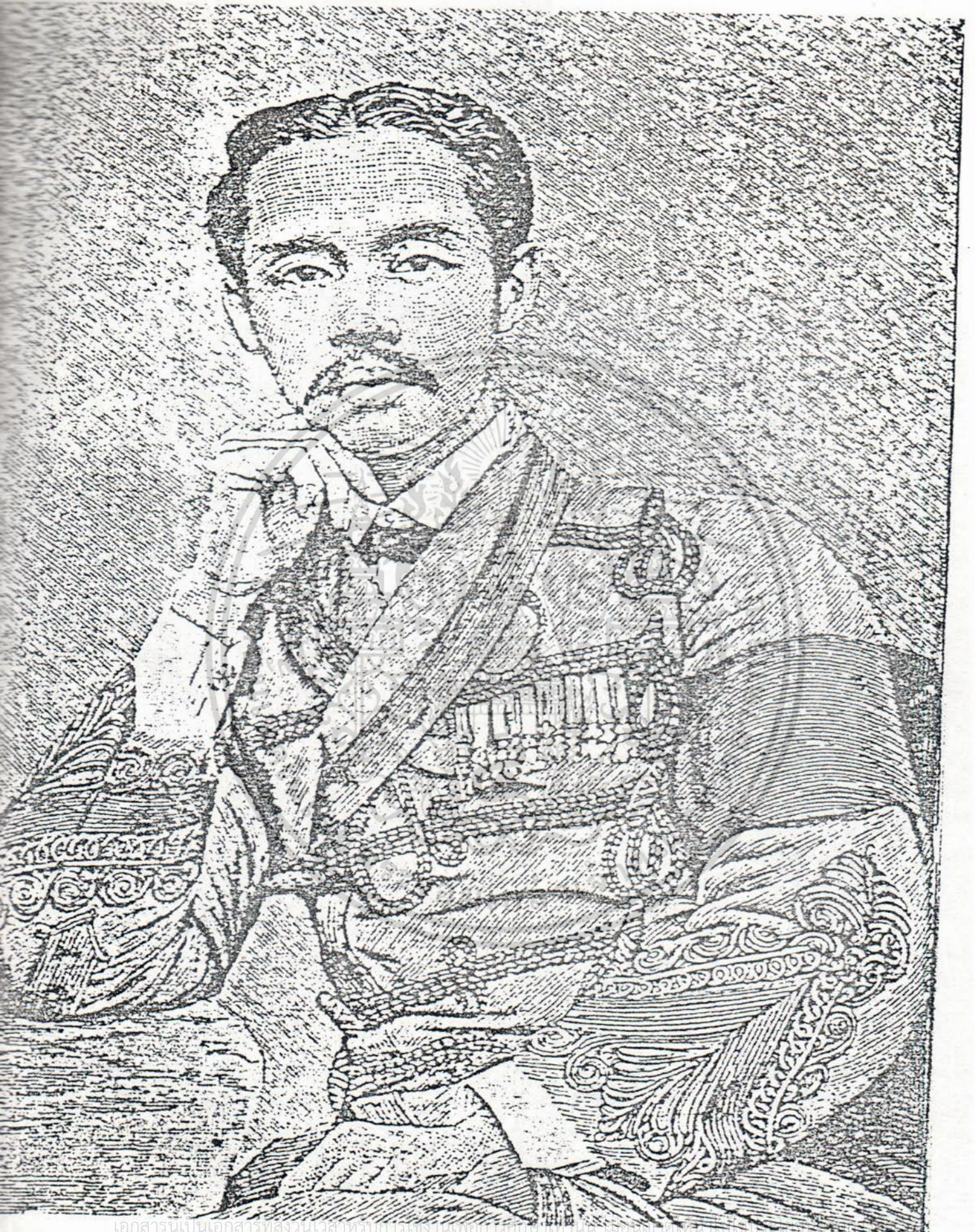
เอกสารนเป็นเอกสารทสวงนเวลาทวกับการเงานเพอการทกอไทนผ ไมอญูเดทททททท ไมวากรณีใดๆ ทั้งสิ้น อีกทั้งห้ามมิให้ดัดแปลงเนื้อหา และต้องอ้างอิงถึงเจ้าของเอกสารทุกครั้งที่มีการนำไปใช้ สมเด็จพระจุลจอมเกล้าเจ้าอยู่หัว เมื่อพระชนม์มายุังน้อย