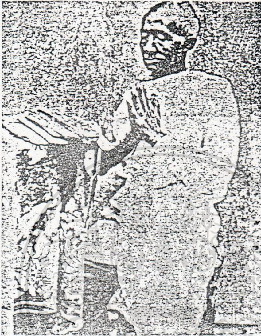
สมเด็จพระจอมเกล้าเจ้าอยู่หัว ขณะยังทรงผนวชเป็นพระภิกษุ

เอกสารนี้เป็นเอกสารที่สงวนไว้สำหรับการใช้งานเพื่อการศึกษาเท่านั้น ไม่อนุญาตให้นำไปใช้ประโยชน์ด้านการค้า ไม่ว่ากรณีใดๆ ทั้งสิ้น อีกทั้งห้ามมิให้ดัดแปลงเนื้อหา และต้องอ้างอิงถึงเจ้าของเอกสารทุกครั้งที่มีการนำไปใช้