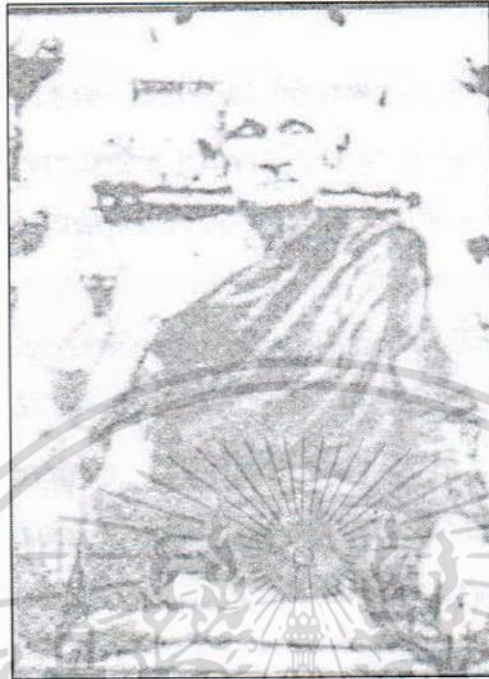
สมเด็จพระมหาสมณเจ้า กรมพระยาปวเรศวริยาลงกรณ์ สมเด็จพระสังฆราชที่เป็นพระธรรมยุตองค์แรก

เรื่องความประพฤติของพระสงฆ์ในสมัยรัชกาลที่ ๓ แม้ พระวินัยจะหย่อนยานไปบ้างก็ทรงดูแลควบคุมอย่างเอาพระทัยใส่พระองค์เอง