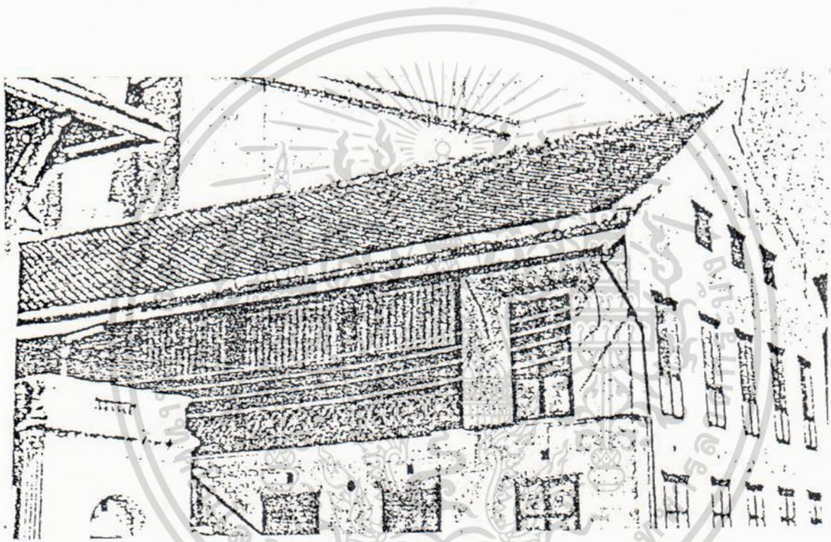
พระที่นั่งอิศเรศราชานุสรณ์ จอมเกล้าเจ้าคุณทหาร

เอกสารนี้เป็นเอกสารที่สงวนไว้สำหรับการใช้งานเพื่อการศึกษาเท่านั้น ไม่อนุญาตให้นำไปใช้ประโยชน์ด้านการค้า ไม่ว่ากรณีใดๆ ทั้งสิ้น อีกทั้งห้ามมิให้ดัดแปลงเนื้อหา และต้องอ้างอิงถึงเจ้าของเอกสารทุกครั้งที่มีการนำไปใช้