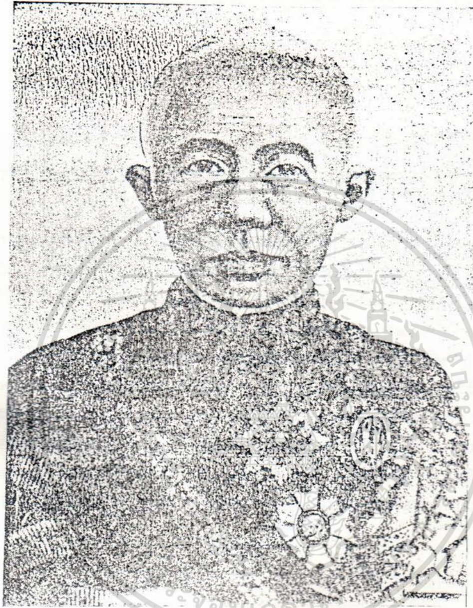
พระบาทสมเด็จพระจอมเกล้าเจ้าอยู่หัว พระนามเต็มว่า เจ้าฟ้าชายมงกุฎฯ พระราชโอรสในพระบาทสมเด็จพระพุทธเลิศหล้านภาลัย

เอกสารนี้เป็นเอกสารที่สงวนไว้สำหรับการใช้งานเพื่อการศึกษาเท่านั้น ไม่อนุญาตให้นำไปใช้ประโยชน์ด้านการค้า ไม่ว่ากรณีใดๆ ทั้งสิ้น อีกทั้งห้ามมิให้ดัดแปลงเนื้อหา และต้องอ้างอิงถึงเจ้าของเอกสารทุกครั้งที่มีการนำไปใช้