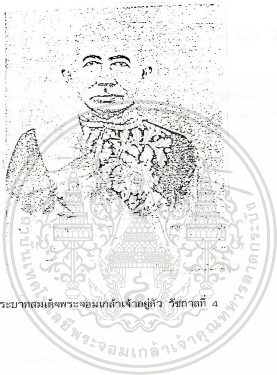
พระบาทสมเด็จพระจอมเกล้าเจ้าอยู่หัว รัชกาลที่ 4

เอกสารนี้เป็นเอกสารที่สงวนไว้สำหรับการใช้งานเพื่อการศึกษาเท่านั้น ไม่อนุญาตให้นำไปใช้ประโยชน์ด้านการค้า ไม่ว่ากรณีใดๆ ทั้งสิ้น อีกทั้งห้ามมิให้ดัดแปลงเนื้อหา และต้องอ้างอิงถึงเจ้าของเอกสารทุกครั้งที่มีการนำไปใช้