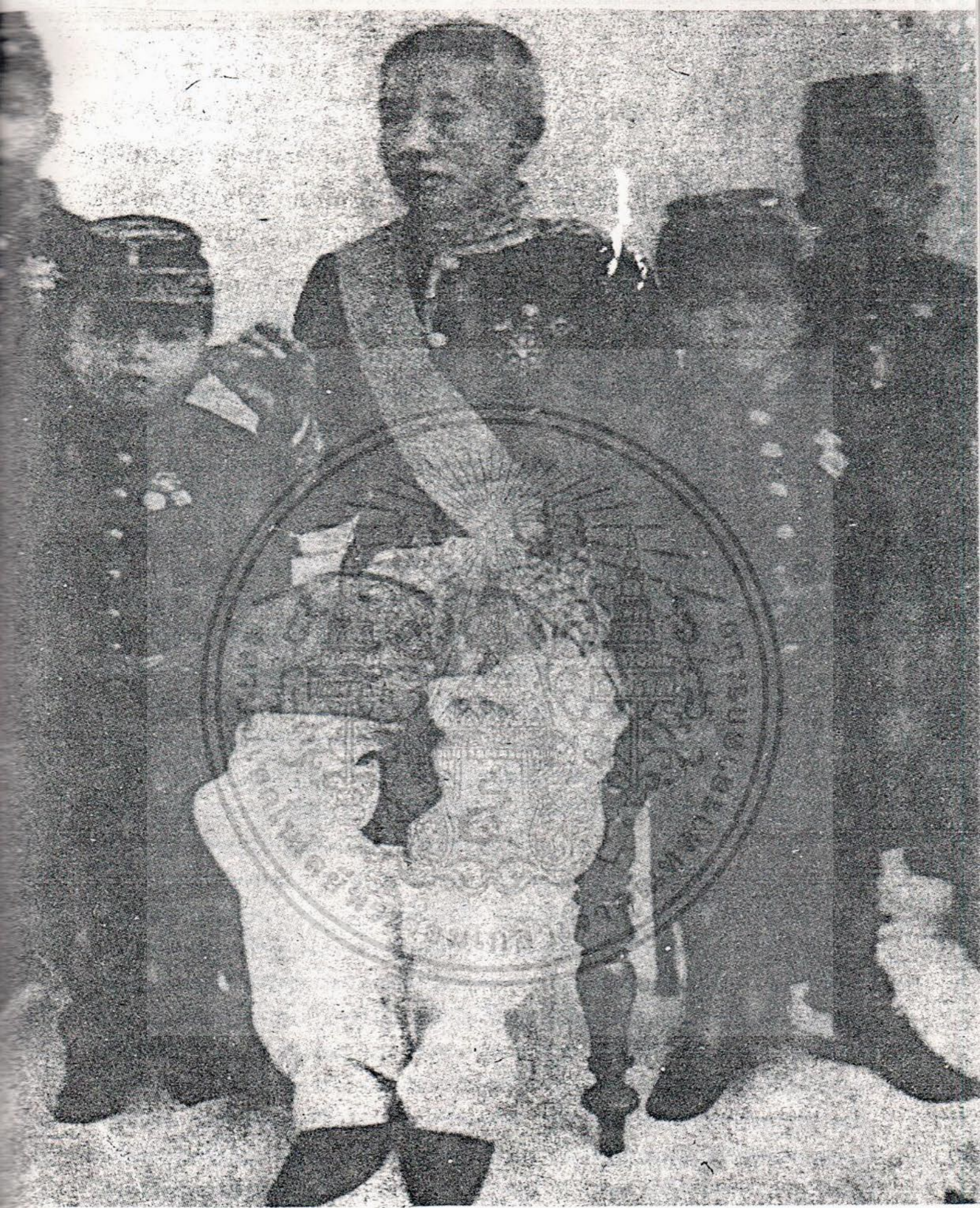
พระบาทสมเด็จพระจอมเกล้าฯ และพระราชโอรส จากซ้าย 1. พระบาทสมเด็จพระเจ้าอยู่หัวรัชกาลที่ 5 2. สมเด็จเจ้าฟ้าภาณุรังษีสว่างวงศ์ (สมเด็จพระราชปิตุลาบรมพงศาภิมุขฯ) ราชธิดา สมเด็จเจ้าฟ้าจุฬาภรณวลัยลักษณ์ (สมเด็จพระนางเจ้าสิริกิติ์ พระบรมราชินีนาถ) 3. สมเด็จเจ้าฟ้าจุฬาภรณวลัยลักษณ์ (สมเด็จพระนางเจ้าสิริกิติ์ พระบรมราชินีนาถ) 4. พระองค์เจ้าคัคณางค์คุณทูล (พระเจ้าบรมวงศ์เธอ กรมหลวงพิชิตปรีชากร)