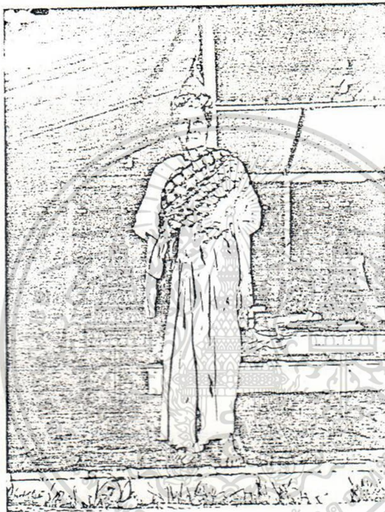
เจ้าจอมมารดาช่อนกลิน

เอกสารนี้เป็นเอกสารที่สงวนไว้สำหรับการใช้งานเพื่อการศึกษาเท่านั้น ไม่อนุญาตให้นำไปใช้ประโยชน์ด้านการค้า ไม่ว่ากรณีใดๆ ทั้งสิ้น อีกทั้งห้ามมิให้ดัดแปลงเนื้อหา และต้องอ้างอิงถึงเจ้าของเอกสารทุกครั้งที่มีการนำไปใช้