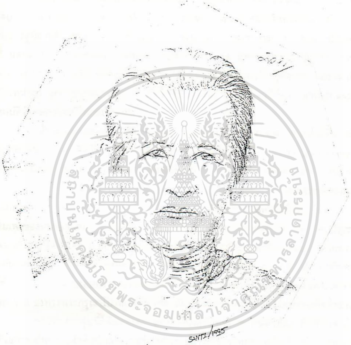
เจ้าจอมมารดาช่อนกลิ่น วาตโดย สันติ ติรอด

เอกสารนี้เป็นเอกสารที่สงวนไว้สำหรับการใช้งานเพื่อการศึกษาเท่านั้น ไม่อนุญาตให้นำไปใช้ประโยชน์ด้านการค้า ไม่ว่ากรณีใดๆ ทั้งสิ้น อีกทั้งห้ามมิให้ดัดแปลงเนื้อหา และต้องอ้างอิงถึงเจ้าของเอกสารทุกครั้งที่มีการนำไปใช้