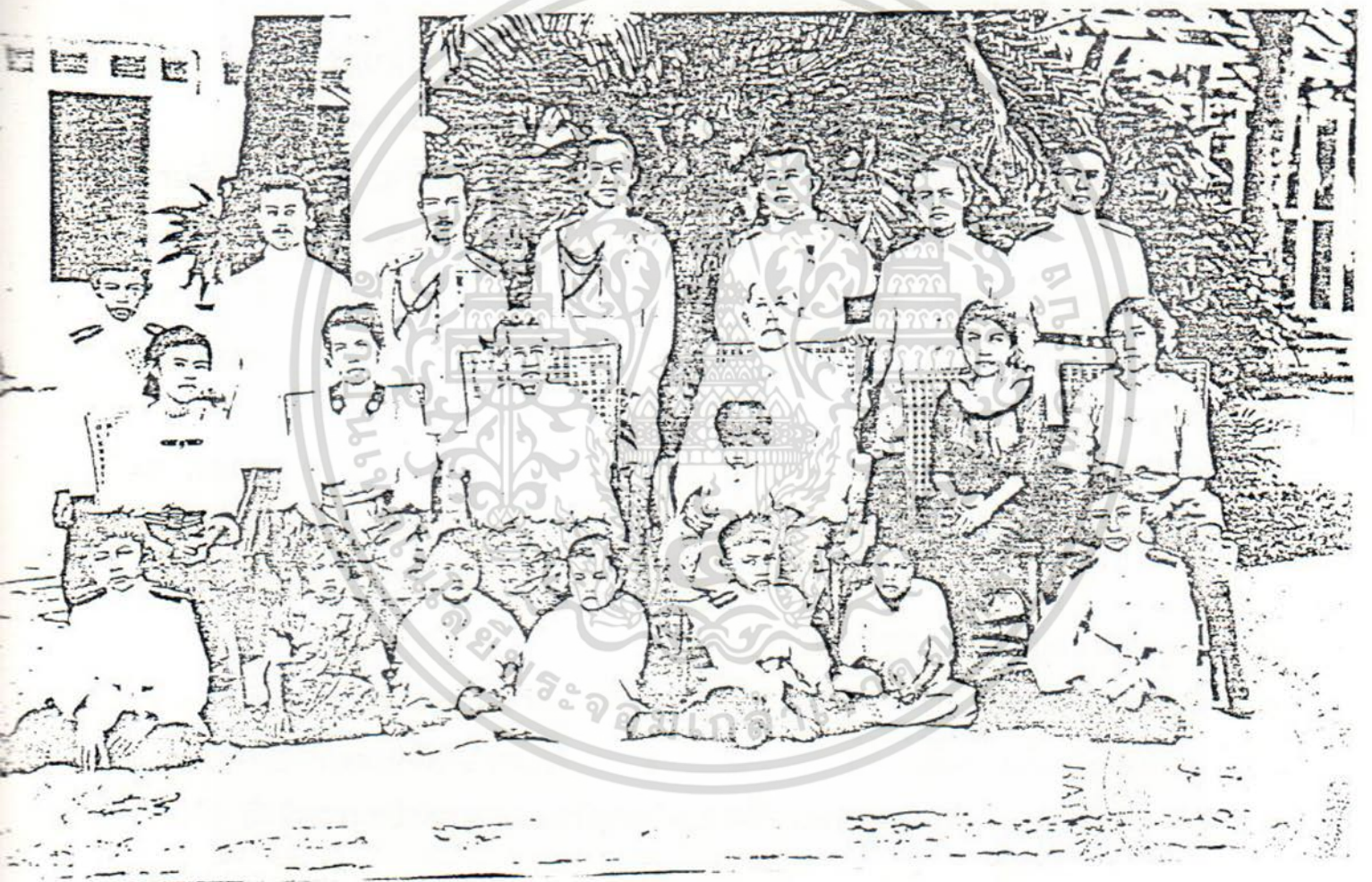
ภาพจอมมารดาช่อนกลิน (แถวที่นั่งที่ 3 จากซ้าย) ทรงฉายร่วมกับพระราชโอรสและพระราชนัดดา

เอกสารนี้เป็นเอกสารที่สงวนไว้สำหรับการใช้งานเพื่อการศึกษาเท่านั้น ไม่อนุญาตให้นำไปใช้ประโยชน์ด้านการค้า ไม่ว่ากรณีใดๆ ทั้งสิ้น อีกทั้งห้ามมิให้ดัดแปลงเนื้อหา และต้องอ้างอิงถึงเจ้าของเอกสารทุกครั้งที่มีการนำไปใช้