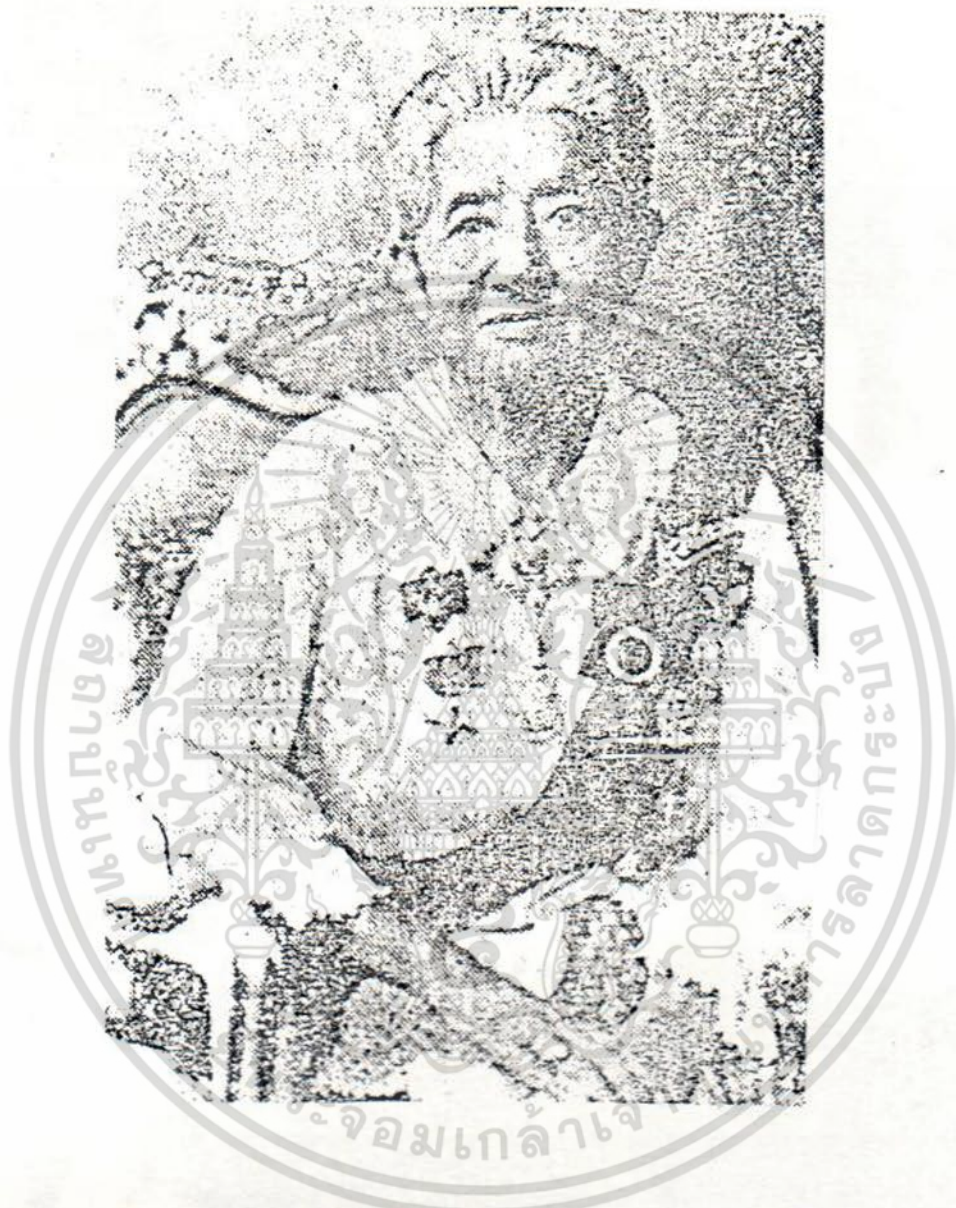
กรมหลวงสมรรัตนสิริเชษฐ พระเจ้าลูกเธอองค์โต ของเจ้าจอมมารดาเที่ยง

เอกสารนี้เป็นเอกสารที่สงวนไว้สำหรับการใช้งานเพื่อการศึกษาเท่านั้น ไม่อนุญาตให้นำไปใช้ประโยชน์ด้านการค้า ไม่ว่ากรณีใดๆ ทั้งสิ้น อีกทั้งห้ามมิให้ตัดแปลงเนื้อหา และต้องอ้างอิงถึงเจ้าของเอกสารทุกครั้งที่มีการนำไปใช้