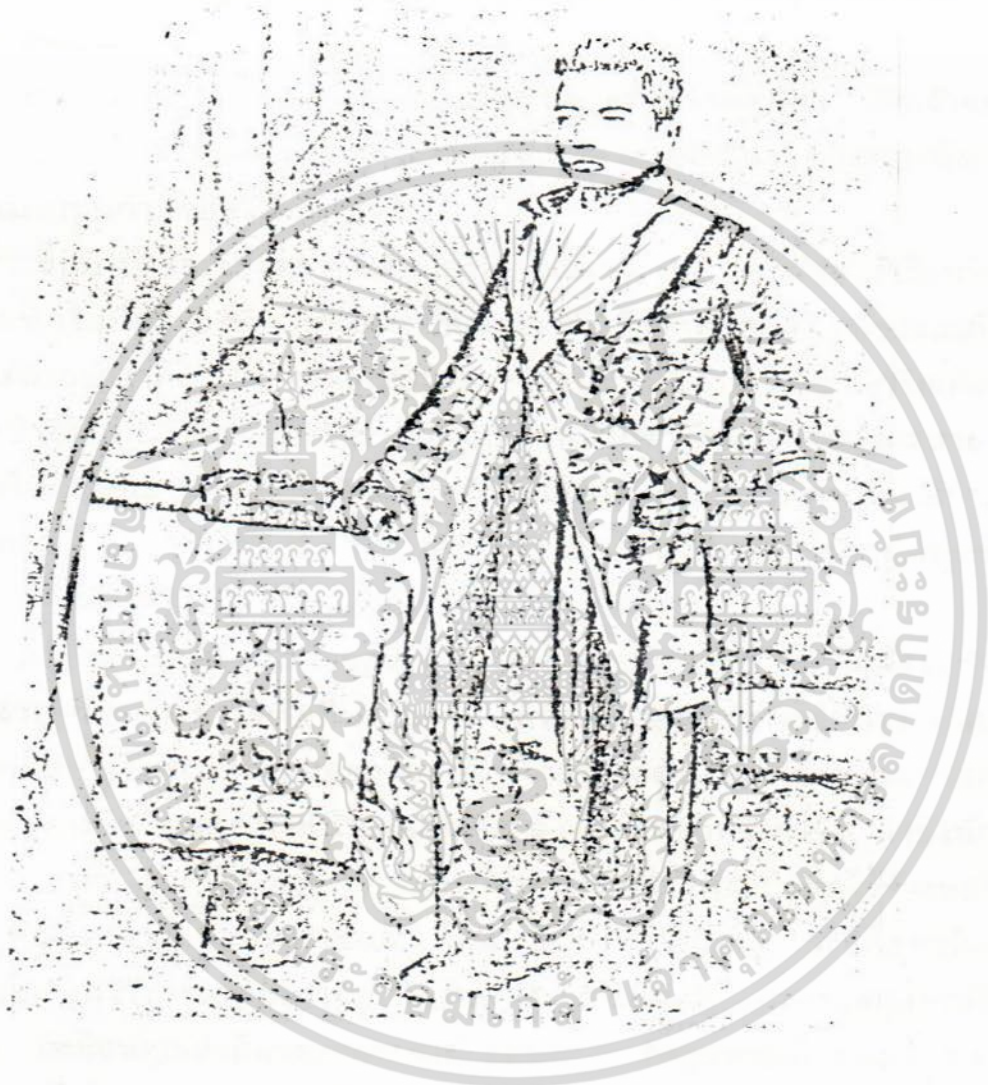
กรมหมื่นวิศุณนารณิกาทรร

เอกสารนี้เป็นเอกสารที่สงวนไว้สำหรับการใช้งานเพื่อการศึกษาเท่านั้น ไม่อนุญาตให้นำไปใช้ประโยชน์ด้านการค้า ไม่ว่ากรณีใดๆ ทั้งสิ้น อีกทั้งห้ามมิให้ดัดแปลงเนื้อหา และต้องอ้างอิงถึงเจ้าของเอกสารทุกครั้งที่มีการนำไปใช้