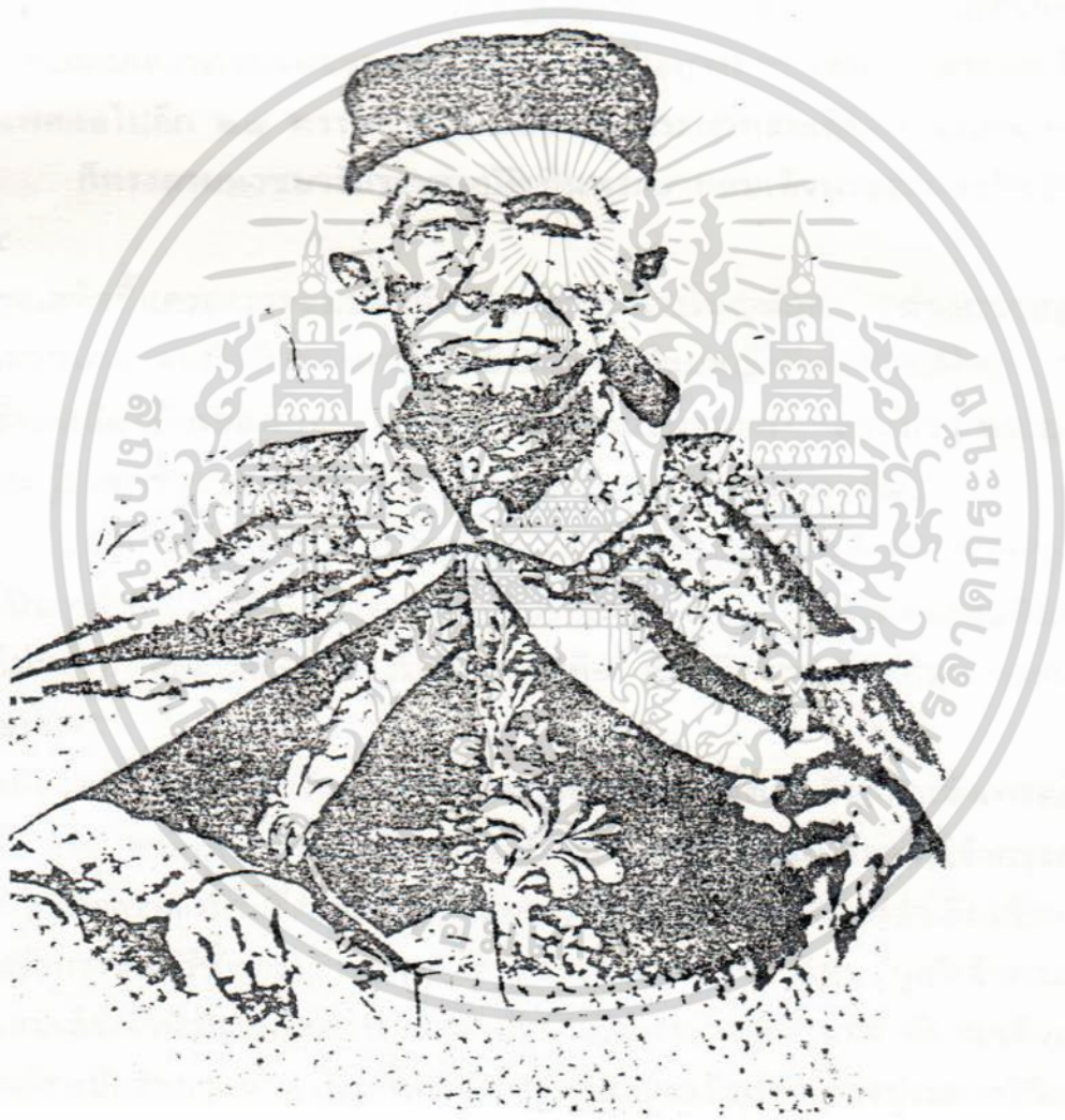
พระบาทสมเด็จพระจอมเกล้าเจ้าอยู่หัว

เอกสารนี้เป็นเอกสารที่สงวนไว้สำหรับการใช้งานเพื่อการศึกษาเท่านั้น ไม่อนุญาตให้นำไปใช้ประโยชน์ด้านการค้า ไม่ว่ากรณีใดๆ ทั้งสิ้น อีกทั้งห้ามมิให้ดัดแปลงเนื้อหา และต้องอ้างอิงถึงเจ้าของเอกสารทุกครั้งที่มีการนำไปใช้