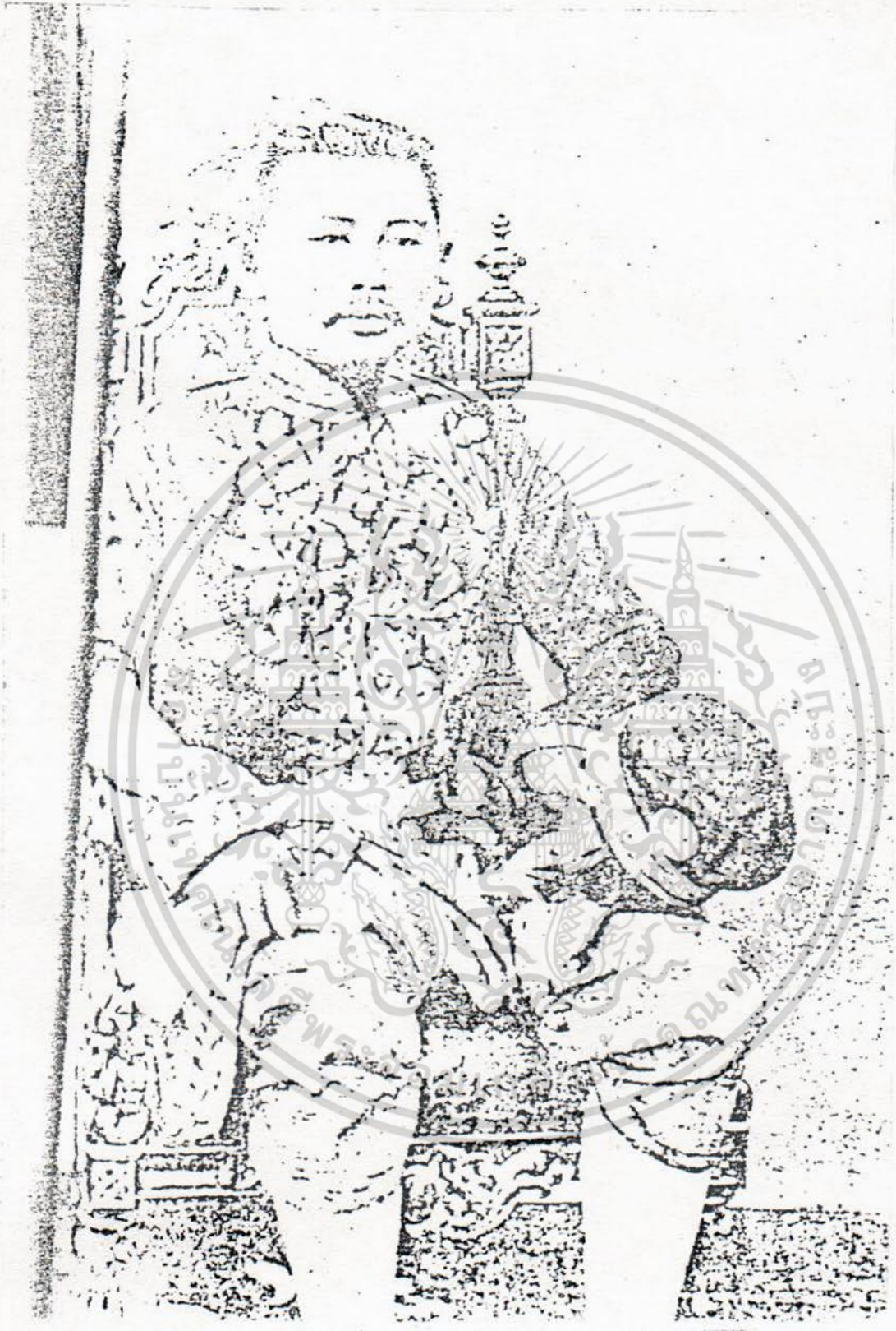
กรมหมื่นมเหศวรศิววิลาส

เอกสารนี้เป็นเอกสารที่สงวนไว้สำหรับการใช้งานเพื่อการศึกษาเท่านั้น ไม่อนุญาตให้นำไปใช้ประโยชน์ด้านการค้า ไม่ว่ากรณีใดๆ ทั้งสิ้น อีกทั้งห้ามมิให้ดัดแปลงเนื้อหา และต้องอ้างอิงถึงเจ้าของเอกสารทุกครั้งที่มีการนำไปใช้