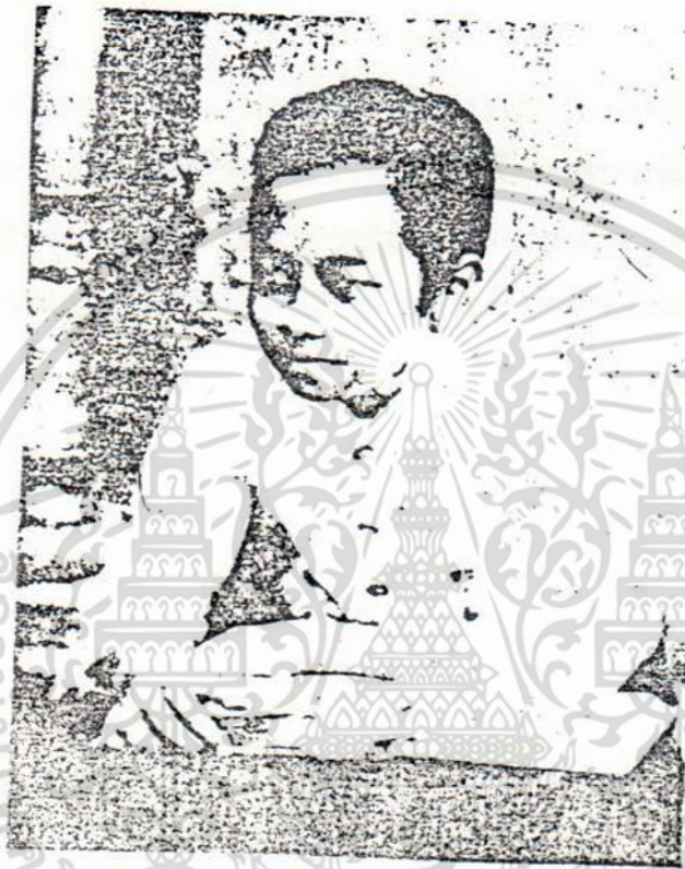
เจ้าฟ้าจุฬาลงกรณ์ ทรงกำพร้าพระมารดา ตั้งแต่วัยพระชนม์ได้เพียง ๘ ปี

เอกสารนี้เป็นเอกสารที่สงวนไว้สำหรับการใช้งานเพื่อการศึกษาเท่านั้น ไม่อนุญาตให้นำไปใช้ประโยชน์ด้านการค้า ไม่ว่ากรณีใดๆ ทั้งสิ้น อีกทั้งห้ามมิให้ดัดแปลงเนื้อหา และต้องอ้างอิงถึงเจ้าของเอกสารทุกครั้งที่มีการนำไปใช้