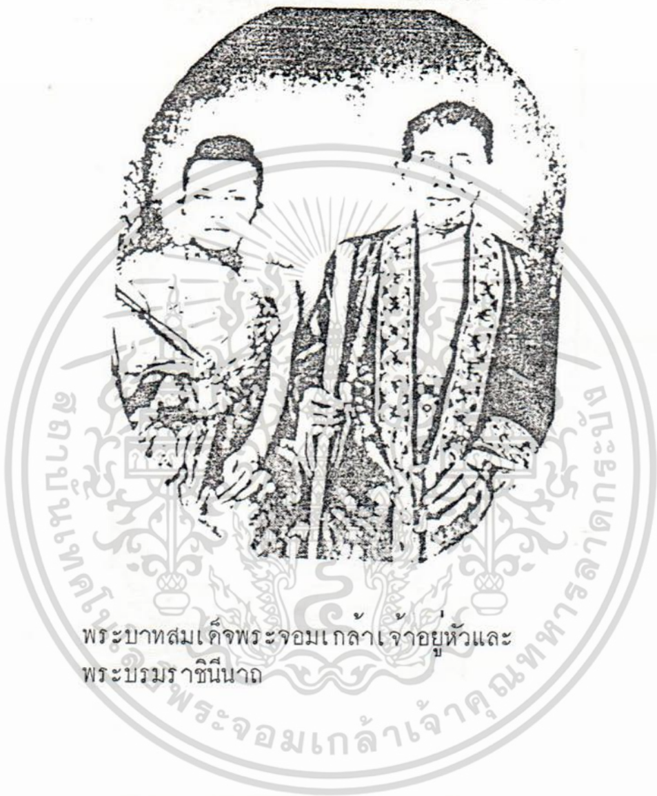
พระบาทสมเด็จพระจอมเกล้าเจ้าอยู่หัวและ พระบรมราชินีนาถ

เอกสารนี้เป็นเอกสารที่สงวนไว้สำหรับการใช้งานเพื่อการศึกษาเท่านั้น ไม่อนุญาตให้นำไปใช้ประโยชน์ด้านการค้า ไม่ว่ากรณีใดๆ ทั้งสิ้น อีกทั้งห้ามมิให้ดัดแปลงเนื้อหา และต้องอ้างอิงถึงเจ้าของเอกสารทุกครั้งที่มีการนำไปใช้