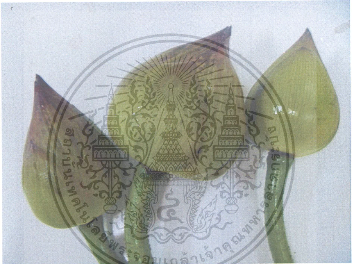
รูปที่ 3. ลักษณะดอกบัวที่จุ่มด้วยสารปิโตรเลียมมอดยส์

เอกสารนี้เป็นเอกสารที่สงวนไว้สำหรับการใช้งานเพื่อการศึกษาเท่านั้น ไม่อนุญาตให้นำไปใช้ประโยชน์ด้านการค้า ไม่ว่ากรณีใดๆ ทั้งสิ้น อีกทั้งห้ามมิให้ดัดแปลงเนื้อหา และต้องอ้างอิงถึงเจ้าของเอกสารทุกครั้งที่มีการนำไปใช้