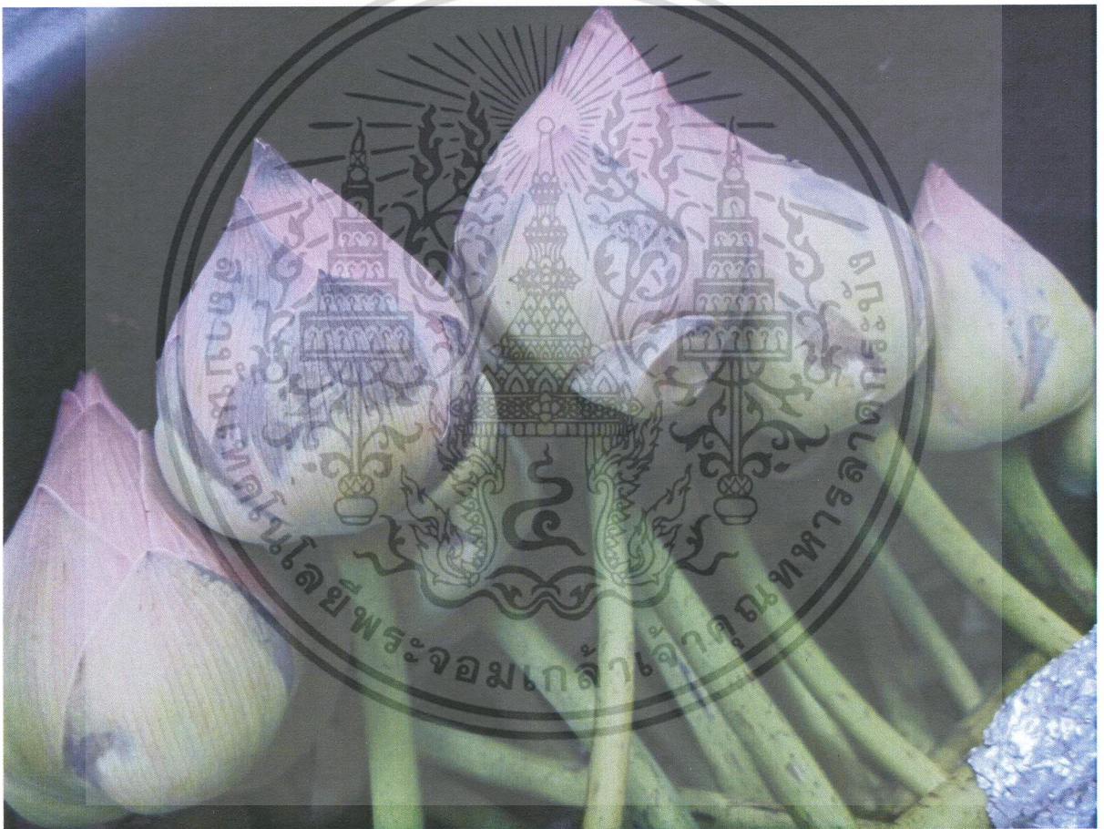
รูปที่ 2. กลีบดอกบัวเป็นสีน้ำตาลดำเมื่อขาดน้ำและธาตุอาหาร

คุณภาพปากแจกันของดอกบัว ดอกบัวหลวงเป็นดอกไม้ที่กลีบเป็นสีน้ำตาลดำได้อย่างรวดเร็ว เหี่ยวเร็ว เมื่อขาดน้ำและธาตุอาหาร(รูปที่ 2) สาเหตุน่าจะเกิดจากน้ำยางไหลออกมาอุดตันตรงรอยตัดของก้านดอกมีผลต่อการดูดน้ำของดอกบัว(ช.ณัฐศิริและคณะ, 2548) การศึกษาพบว่าการจุ่มด้วยสารวุ้นหางจรเข้และchitosanไม่มีผลต่อคุณภาพดอกบัว ส่วนปิโตรเลียมออกซอลมี การซึมเข้าไปในเนื้อเยื่อของดอก(รูปที่ 3) และน้ำส้มควันไม้มีผลทำให้ดอกบัวดำและกลีบดอกไหม้ (รูปที่ 4)