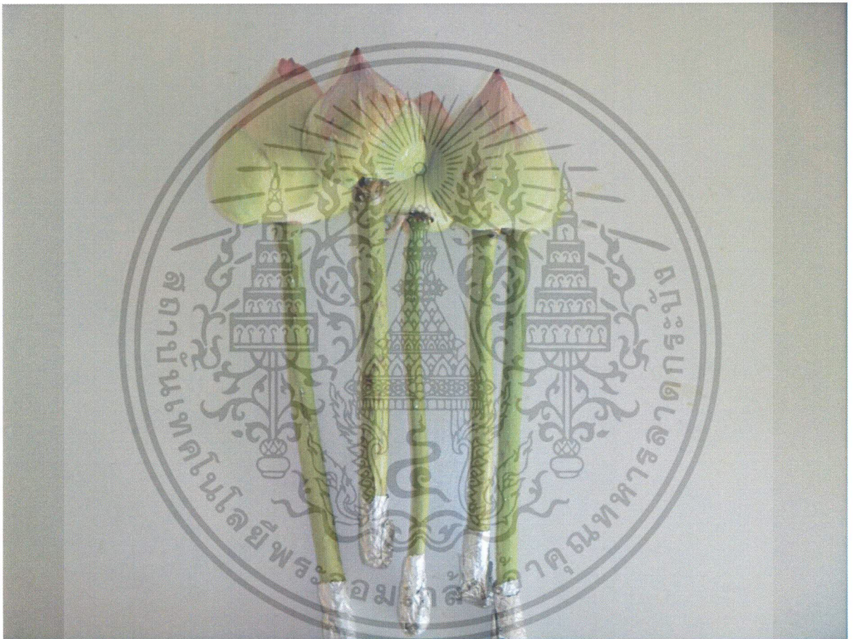
รูปที่ 1. การเตรียมดอกบัวก่อนการจุ่ม

เอกสารนี้เป็นเอกสารที่สงวนไว้สำหรับการใช้งานเพื่อการศึกษาเท่านั้น ไม่อนุญาตให้นำไปใช้ประโยชน์ด้านการค้า ไม่ว่ากรณีใดๆ ทั้งสิ้น อีกทั้งห้ามมิให้ดัดแปลงเนื้อหา และต้องอ้างอิงถึงเจ้าของเอกสารทุกครั้งที่มีการนำไปใช้