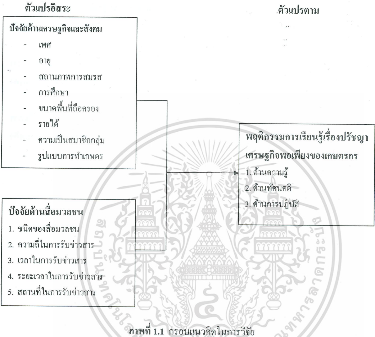
ภาพที่ 1.1 กรอบแนวคิดในการวิจัย