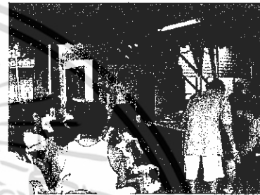
ภาพประกอบ 2: การจัดเวทีชุมชนของชุมชนสามัคคีร่วมใจเพื่อหาฉันทมติเบื้องต้นในการร่วมโครงการ "บ้านมั่นคง"