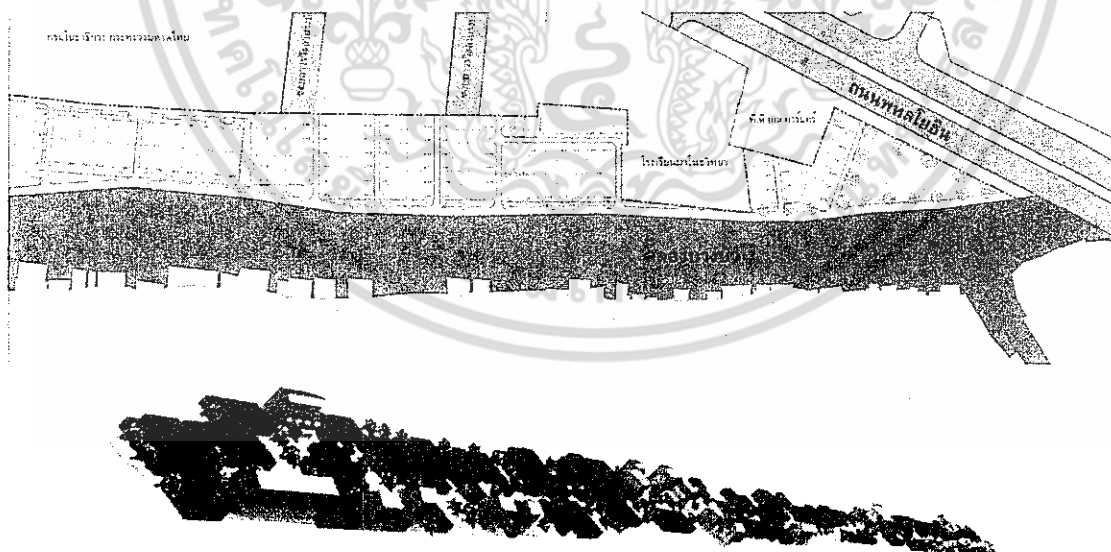
ภาพประกอบ 3: แบบร่างขั้นต้นของผังชุมชนสามัคคีร่วมใจภายหลังปรับปรุงที่เกิดจากการร่วมออกแบบของชาวชุมชนโดยความช่วยเหลือของสถาปนิก (รูปบน) และแนวทางการแก้ปัญหาที่อยู่อาศัยของชุมชนร้อยกรองที่ใช้การปรับผังใหม่บนที่ดินเดิม โดยการรื้อย้ายบางส่วน (รูปล่าง)

เอกสารนี้เป็นเอกสารที่สงวนไว้สำหรับการใช้งานเพื่อการศึกษาเท่านั้น ไม่อนุญาตให้นำไปใช้ประโยชน์ด้านการค้าไม่ว่ากรณีใดๆ ทั้งสิ้น อีกทั้งห้ามมิให้ตัดแปลงเนื้อหา และต้องอ้างอิงถึงเจ้าของเอกสารทุกครั้งที่มีการนำไปใช้