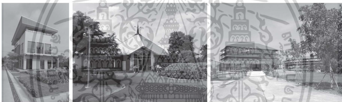
อาคารชัยยุทธ