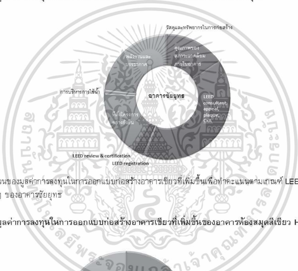
รูปที่ 3 สัดส่วนของมูลค่าการลงทุนในการออกแบบก่อสร้างอาคารเขียวที่เพิ่มขึ้นเพื่อทำคะแนนตามเกณฑ์ LEED ในหัวข้อต่างๆ ของอาคารชัยยุทธ