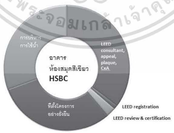
รูปที่ 4 สัดส่วนของมูลค่าการลงทุนในการออกแบบก่อสร้างอาคารเขียวที่เพิ่มขึ้นเพื่อทำคะแนนตามเกณฑ์ LEED ในหัวข้อต่างๆ ของอาคารห้องสมุดสีเขียว HSBC

เอกสารนี้เป็นเอกสารที่สงวนไว้สำหรับการทำงานเพื่อการศึกษาเท่านั้น ไม่อนุญาตให้นำไปใช้ประโยชน์ด้านการค้าไม่ว่ากรณีใดๆ ทั้งสิ้น อีกทั้งห้ามมิให้ตัดแปลงเนื้อหา... อย่างไรก็ดีถึงเจ้าของเอกสารทุกครั้งที่มีการนำไปใช้