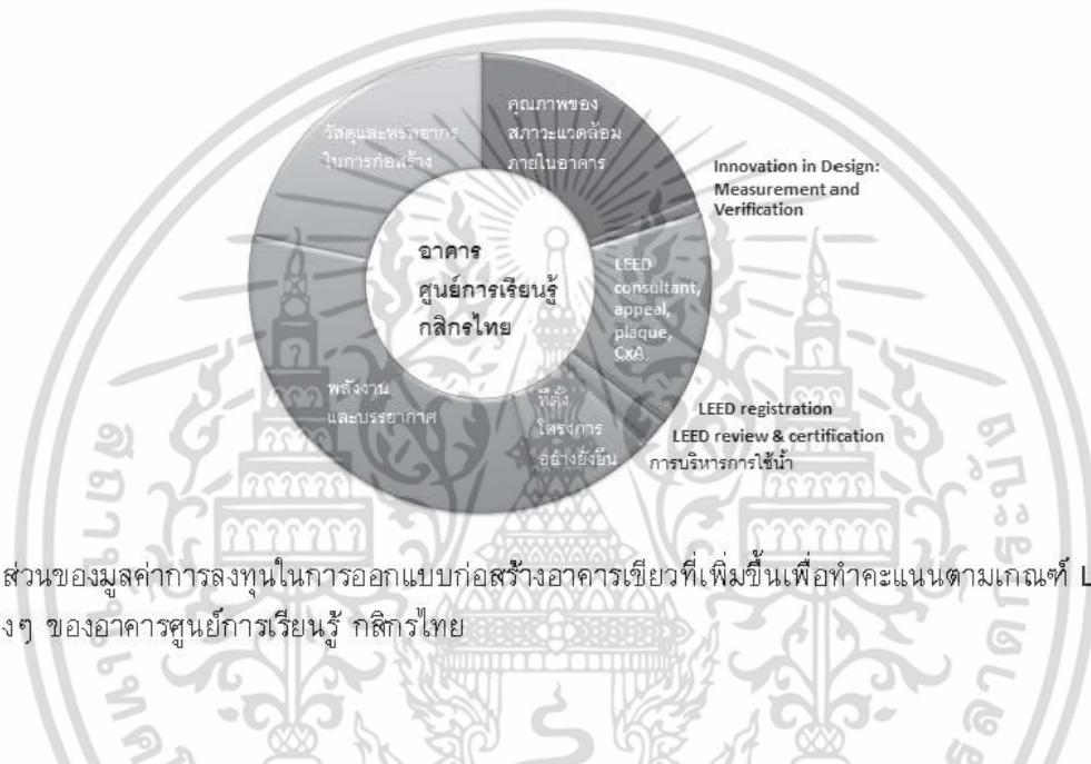
รูปที่ 5 สัดส่วนของมูลค่าการลงทุนในการออกแบบก่อสร้างอาคารเขียวที่เพิ่มขึ้นเพื่อทำคะแนนตามเกณฑ์ LEED ในหัวข้อต่างๆ ของอาคารศูนย์การเรียนรู้ กสิกรไทย

สัดส่วนของมูลค่าการลงทุนในการออกแบบก่อสร้างอาคารเขียวที่เพิ่มขึ้นของอาคารศูนย์การเรียนรู้ กสิกรไทย