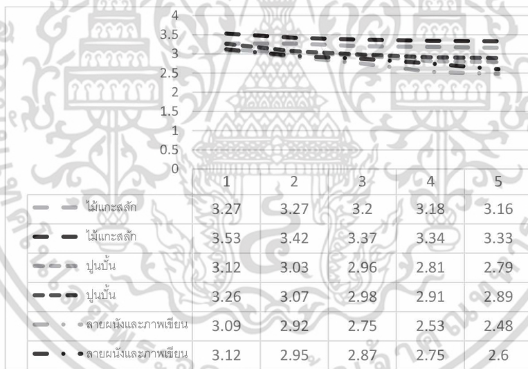
แผนภูมิ 3 แสดงการรับรู้อัตลักษณ์ผ่านภาพลักษณ์รายละเอียดสถาปัตยกรรม และกลุ่มลายผนังกับภาพเขียนผนัง