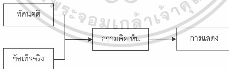
แผนภูมิ 1 ลักษณะของความคิดเห็นการแสดงเหตุผล

วิธีการวัดทัศนคติหรือเจตคติ (Attitude) ทำได้หลายอย่าง สำหรับการวิจัยนี้ ใช้การวัดแบบเทอร์สตัน (Louis Thurstone, 1928) ซึ่งเชื่อว่าทัศนคติของบุคคลที่มีต่อสิ่งใดสิ่งหนึ่ง ย่อมแตกต่างกันจากน้อยที่สุดไปถึงมากที่สุด จึงแบ่งระดับทัศนคติออกเป็นระดับ จากความรู้สึกเห็นด้วยน้อยที่สุดไปจนถึงระดับความรู้สึกที่เห็นด้วยมากที่สุด เรียกว่า มาตราส่วนประมาณค่า (Rating Scale)