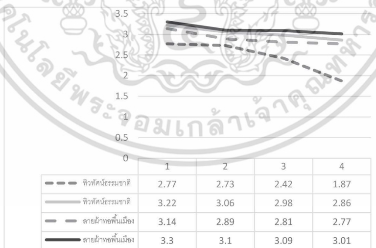
แผนภูมิ 1 แสดงการรับรู้อัตลักษณ์ล้านนาผ่านรูปภาพที่ไม่เกี่ยวข้องกับสถาปัตยกรรม

3. การรับรู้อัตลักษณ์ล้านนาผ่านรูปภาพกลุ่มรายละเอียดสถาปัตยกรรม ชาวต่างชาติเห็นว่าจะสามารถรับรู้อัตลักษณ์ล้านนาผ่านกลุ่มไม้แกะสลักในระดับมากที่สุดและเป็นระดับสูงสุดของทุกกลุ่ม กลุ่มปูนปั้นอยู่ในระดับมากที่สุดถึงมากที่สุด และกลุ่มลายผนังกับภาพเขียนอยู่ในระดับมาก ส่วนคนไทยเห็นว่าจะสามารถรับรู้อัตลักษณ์ล้านนาผ่านกลุ่มไม้แกะสลักในระดับมากที่สุดถึงมากที่สุด ซึ่งมีคะแนนสูงสุดในทุกกลุ่มเช่นเดียวกัน กลุ่มปูนปั้นอยู่ในระดับมาก และกลุ่มลายผนังและภาพเขียนอยู่ในระดับมากเช่นเดียวกัน ดังแสดงในแผนภูมิ 3