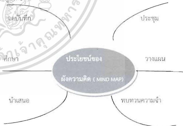
รูปที่ 1 ผังความคิด