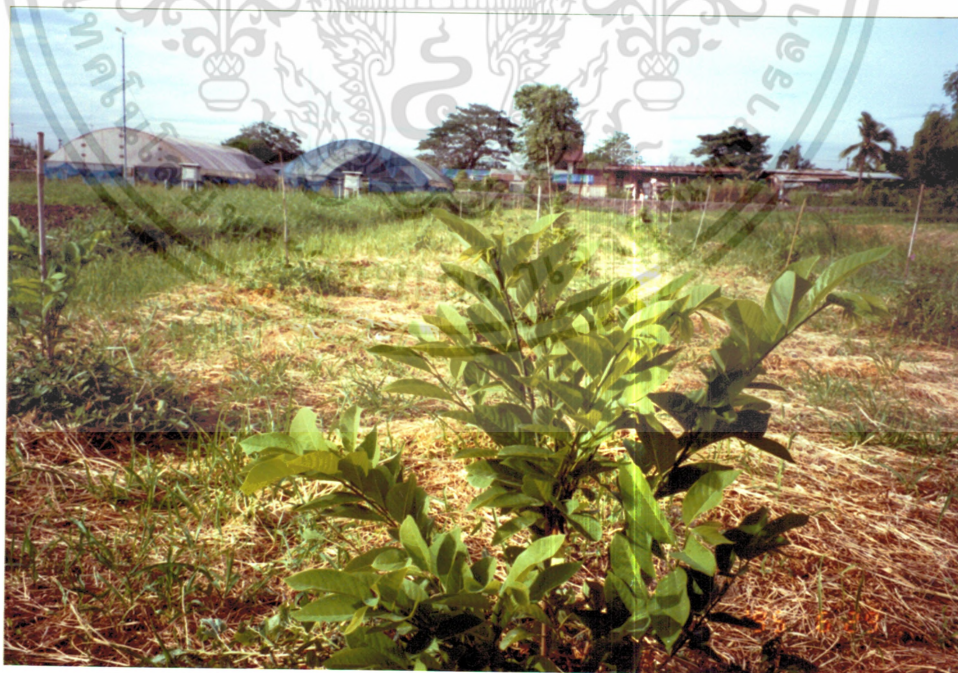
ภาพที่ 4 น้อยหน่า ( Annona squamosa Linn.)

เอกสารนี้เป็นเอกสารที่สงวนไว้สำหรับการใช้งานเพื่อการศึกษาเท่านั้น ไม่อนุญาตให้นำไปใช้ประโยชน์ด้านการค้า ไม่ว่ากรณีใดๆ ทั้งสิ้น อีกทั้งห้ามมิให้ดัดแปลงเนื้อหา และต้องอ้างอิงถึงเจ้าของเอกสารทุกครั้งที่มีการนำไปใช้