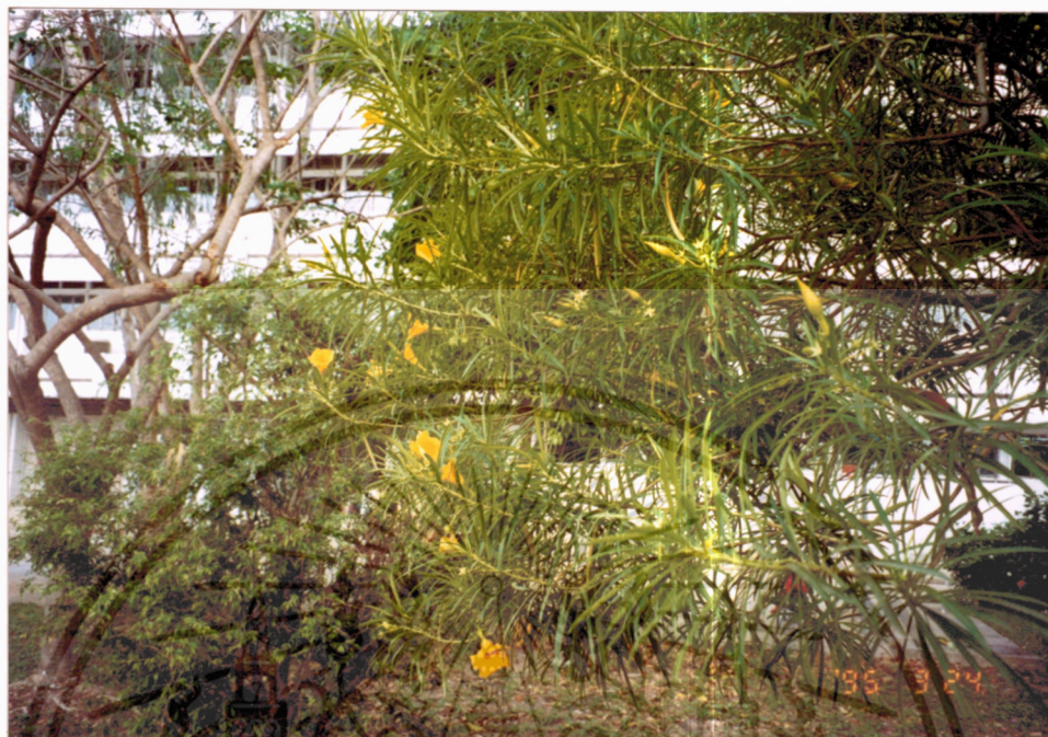
ภาพที่ 7 รำเพย ( Thevetia peruviana (Pers.) Schum)