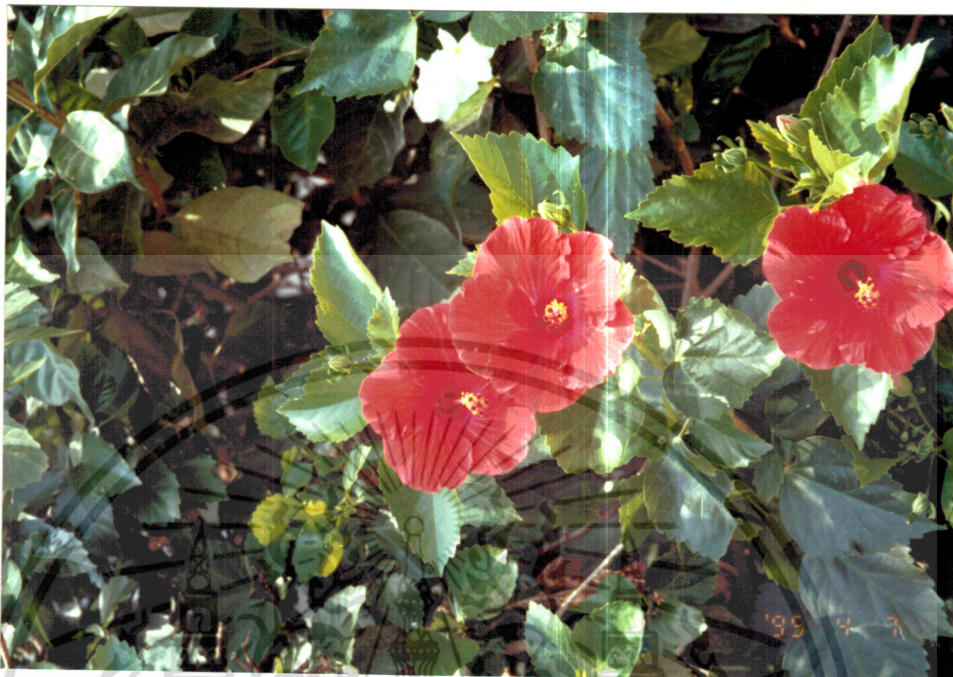
ภาพที่ 3 ชบา ( Hibiscus rosa-sinensis Linn.)