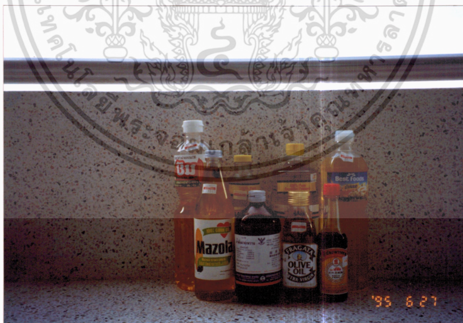
ภาพที่ 8 น้ำมันพืชชนิดต่าง ๆ ที่ใช้ในการทดลอง

เอกสารนี้เป็นเอกสารที่สงวนไว้สำหรับการใช้งานเพื่อการศึกษาเท่านั้น ไม่อนุญาตให้นำไปใช้ประโยชน์ด้านการค้า ไม่ว่ากรณีใดๆ ทั้งสิ้น อีกทั้งห้ามมิให้ดัดแปลงเนื้อหา และต้องอ้างอิงถึงเจ้าของเอกสารทุกครั้งที่มีการนำไปใช้