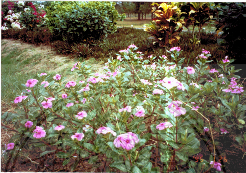
ภาพที่ 5 แพงพวยฝรั่ง ( Catharantus roseus (Linn.) G. Don.)