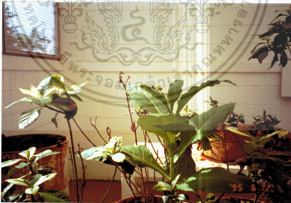
ภาพที่ 6 ยาสูบ ( Nicotiana tabacum Linn.)

เอกสารนี้เป็นเอกสารที่สงวนไว้สำหรับการใช้งานเพื่อการศึกษาเท่านั้น ไม่อนุญาตให้นำไปใช้ประโยชน์ด้านการค้า ไม่ว่ากรณีใดๆ ทั้งสิ้น อีกทั้งห้ามมิให้ดัดแปลงเนื้อหา และต้องอ้างอิงถึงเจ้าของเอกสารทุกครั้งที่มีการนำไปใช้