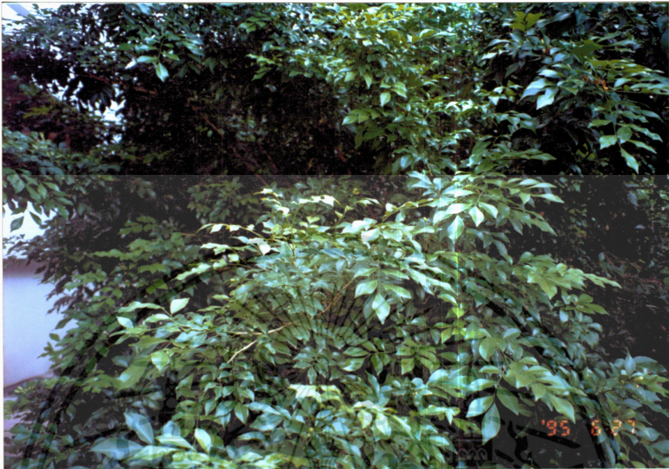
ภาพที่ 1 แก้ว ( Murraya paniculata Jack)