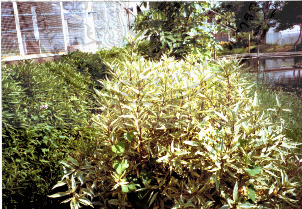
ภาพที่ 2 ชาไก่ต่าง ( Justicia fragilis var. variegata Wall)

เอกสารนี้เป็นเอกสารที่สงวนไว้สำหรับการใช้งานเพื่อการศึกษาเท่านั้น ไม่อนุญาตให้นำไปใช้ประโยชน์ด้านการค้า ไม่ว่าจะกรณีใดๆ ทั้งสิ้น อีกทั้งห้ามมิให้ดัดแปลงเนื้อหา และต้องอ้างอิงถึงเจ้าของเอกสารทุกครั้งที่มีการนำไปใช้