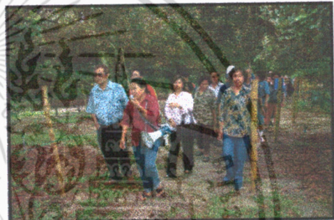
การให้ความรู้แก่เด็กท่องเที่ยว