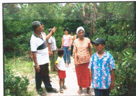
มัคคุเทศน์น้อย

เอกสารนี้เป็นเอกสารที่สงวนไว้สำหรับการใช้งานเพื่อการศึกษาเท่านั้น ไม่อนุญาตให้นำไปใช้ประโยชน์ด้านการค้า ไม่ว่ากรณีใดๆ ทั้งสิ้น อีกทั้งห้ามมิให้ตัดแปลงเนื้อหา และต้องอ้างอิงถึงเจ้าของเอกสารทุกครั้งที่มีการนำไปใช้