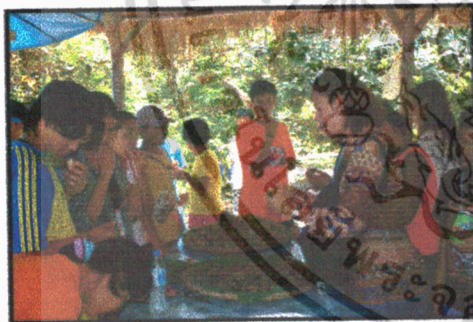
ชมชิมอิมพอร์ตในสวน