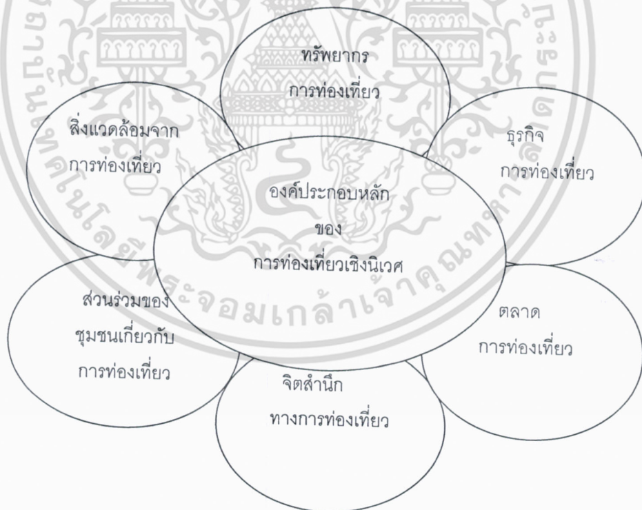
ภาพที่ 2-2 องค์ประกอบหลักของการท่องเที่ยวเชิงนิเวศ

6.) องค์ประกอบด้านสิ่งแวดล้อมจากการท่องเที่ยว หมายถึง สิ่งแวดล้อมในแหล่งท่องเที่ยวที่ได้รับผลกระทบด้านก่อให้เกิดผลประโยชน์และด้านก่อให้เกิดผลเสียหายจากการท่องเที่ยว