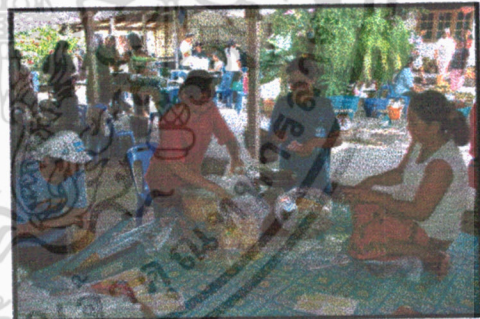
กระจายรายได้สู่ชุมชน