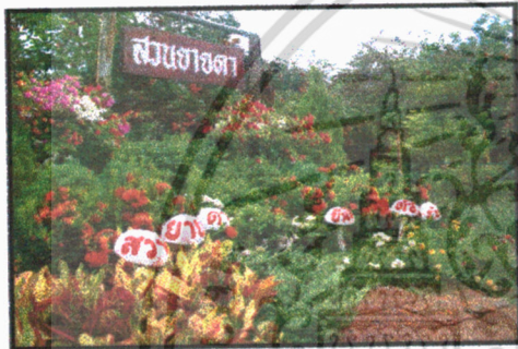
สวนชองตา