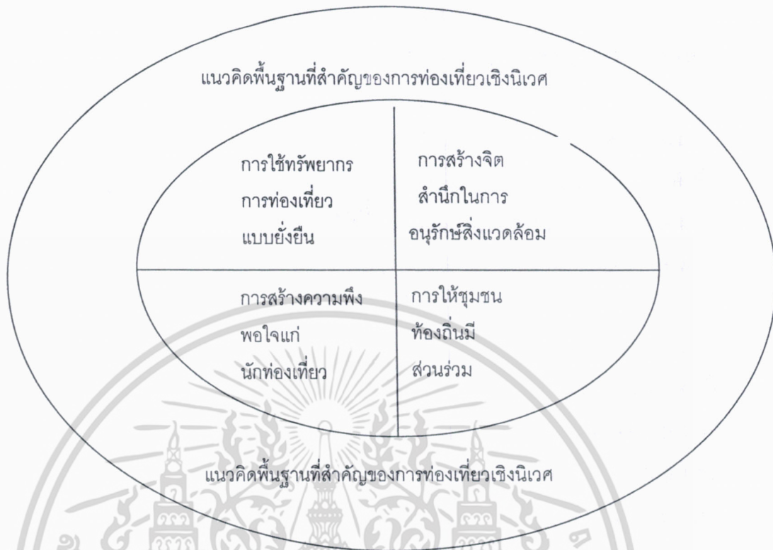
ภาพที่ 2-1 แนวคิดพื้นฐานที่สำคัญของการท่องเที่ยวเชิงนิเวศ