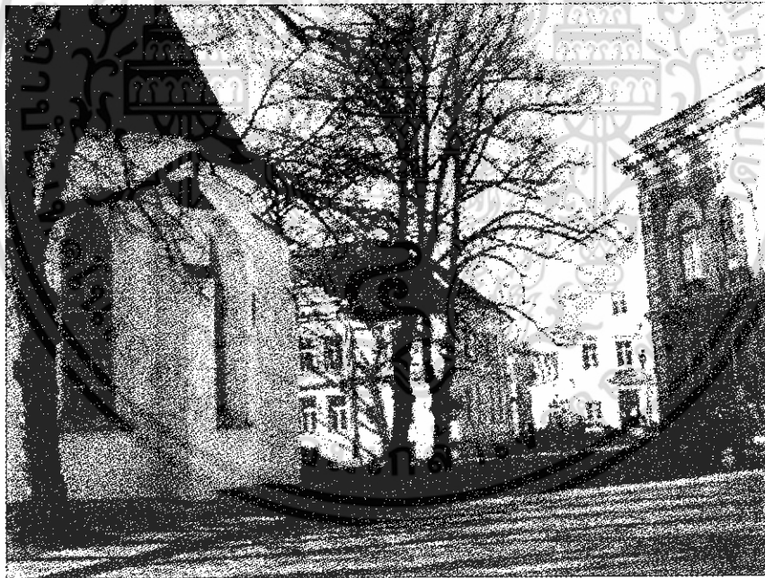
ภาพที่ 5 เมืองทาลินน์ ได้รับการแลกเปลี่ยนติดต่อทางวัฒนธรรม และมรดกอันล้ำค่ายิ่งจากอิทธิพลด้านสถาปัตยกรรมยุโรปโดยตรง ซึ่งสะท้อนถึงเอกลักษณ์ประจำถิ่น อันเป็นสัญลักษณ์ความเป็นตัวตนของตนเอง โดยเฉพาะบรรยากาศในบริเวณโดยรอบ มีสภาพแวดล้อม งานด้าน สถาปัตยกรรมที่โดดเด่น มีคุณค่ายิ่ง สังเกตได้อีกประเด็นหนึ่งว่าตัวอาคารนั้นมีความสัมพันธ์กันอย่างลงตัว อาคารแต่ละหลังมีความสัมพันธ์กันและเชื่อมโยงเรื่องราวของวิถีชีวิต

เอกสารนี้เป็นเอกสารที่สงวนไว้สำหรับการใช้งานเพื่อการศึกษาเท่านั้น ไม่อนุญาตให้นำไปใช้ประโยชน์ด้านการค้า ไม่ว่ากรณีใดๆ ทั้งสิ้น อีกทั้งห้ามมิให้ตัดแปลงเนื้อหา และต้องอ้างอิงถึงเจ้าของเอกสารทุกครั้งที่มีการนำไปใช้