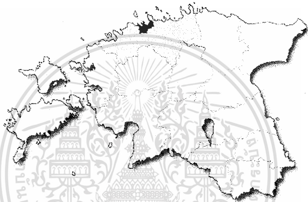
ภาพ Tallinn location.png

ปัจจุบันมี ประชากร 1.324 ล้านคน (กรกฎาคม พ.ศ.2549) มีกลุ่มชนชาติ ชาวเอสโตเนีย 68 % ชนชาติรัสเซีย 26 % ชนชาติยูเครน 2 % ชนชาติเบลารุสเซีย 1 % ฟินแลนด์ 1 % ภาษาพูดใช้ภาษาเอสโตเนีย เป็นภาษาราชการ นอกจากนั้นยังใช้ภาษารัสเซีย และภาษาละตินบ้าง ศาสนาที่มีคนนับถือมากที่สุดคือ ศาสนา Lutheran แต่สำหรับชาวรัสเซียในเอสโตเนียนับถือศาสนาแคทอลิก (นิกายออร์ทอดอกซ์) ส่วนเมืองหลวง คือเมืองทาลลินน์ (Tallinn) ส่วนสกุลเงินครูน Kroon (EEK) อัตราแลกเปลี่ยนโดยประมาณ 15.65 Kroon 1 = Euro/1 E EK = 3.1594 บาท / 1 บาท = 0.31652 EEK