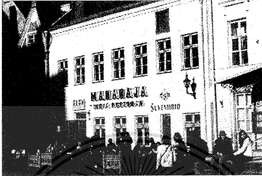
ภาพที่ 4 สภาพอาคารเก่าที่ได้ปรับปรุงขึ้น เพื่อในการตอบสนองกับสังคมสมัยใหม่ มีการจัดพื้นที่ สาธารณะเป็นจำนวนหลายแห่ง เพื่อสร้างบรรยากาศของเมืองที่สวยงาม ให้ผู้คนได้พบปะสังสรรค์กัน ได้มีกิจกรรมภายนอกตัวอาคาร ในรูปแบบหลากหลาย เช่น กินอาหาร ดื่มสุรา เบียร์ และ กาแฟ เป็นต้น