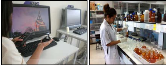
รูปที่ 3 (ซ้าย) การตรวจวัดความส่องสว่างแบบจุด (ขวา) การเก็บตัวอย่างและการวิเคราะห์น้ำทิ้ง

กำจัด ตรวจสอบการติดตั้งเครื่องระบายความร้อน การป้องกันลมร้อนรบกวนผู้สัญจร ตรวจสอบชนิดวัสดุที่ใช้ทำผิวผนังอาคารและการลดแสงสะท้อน