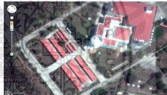
รูปที่ 1 (บน) แบบแปลนของอาคารบรรณสาร (ล่าง) ภาพถ่ายพื้นที่โครงการที่ประเมิน