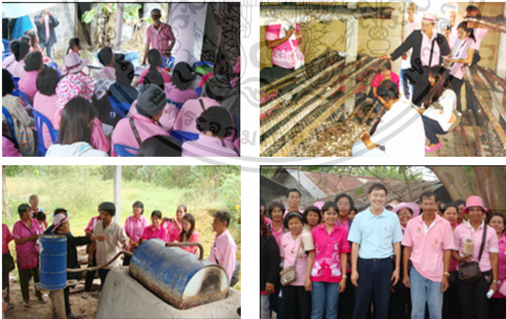
Figure 2 Technology transfer of energy saving and pollution reduction steamer stove for mushroom housing.

X2(2) means technology transfer systems approach