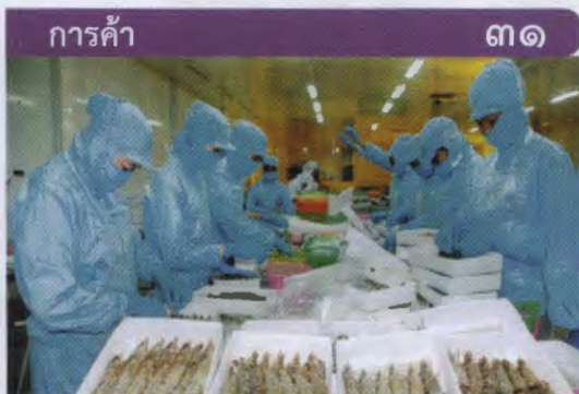
ส่งออกอาหารไทยอันดับ ๑๓ โลก ปี ๖๐ คาดมูลค่าทะลุล้านล้านบาท