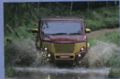
86 ชีวิตอัสระ: ลั้มพีล เบนเนะปราง กัันยกนยณตู่เพอร์อัสระ