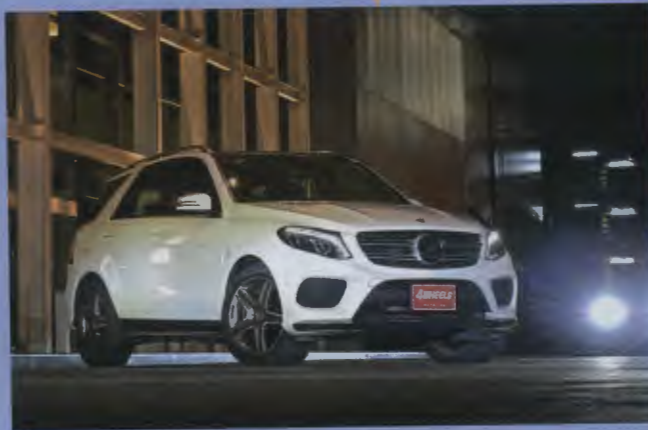
54 ทดสูอ MERCEDES-BENZ GLE 250 D 4MATIC AMG DYNAMIC VS VOLVO XC90 D5 AWD MOMENTUM