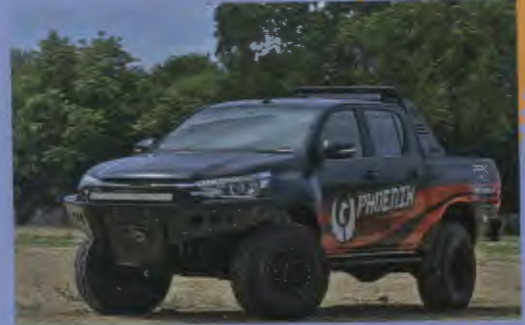
70 แลรถคัันรัก เฟอร์ด เรนเจอร์ ที 6 3.2 ลิตร ขับเคลื่อ 4 ล้อ