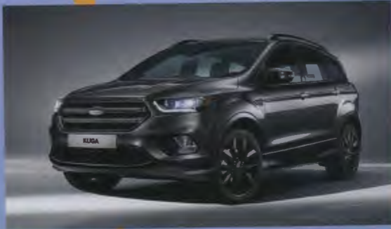
50 พลกดสูอ ต่างแคน เฟอร์ด คูท