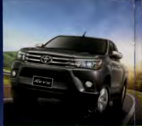
TOYOTA HILUX REVO SMART CAB PRERUNNER 2.4E PLUS AT ขับ 2 ยกสูง เทคโนโลยี "สุโก้ย"

ชีวิตอิสระ: แบบ "เนินมะปราง" กับ ท້อาร์ ทรานส์เฟอร์เมอร์ ทุ