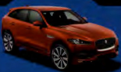
แถมกล่องรถใหม่

● 4 รถรอส์ไอเวอร์ร์ สุดคูล ● 10 ข่าวดี ● ของขวัญสุดล้ำ