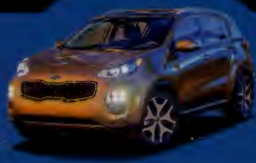
ผลทดสอบต่างแดน