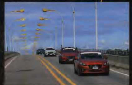
84 ชีวิตอิสระ: MAZDA SKYACTIV ASEAN CARAVAN 1,834 กม. บนเส้นทางสุดระห่ำ ฮานอย-โฮจิมินห์