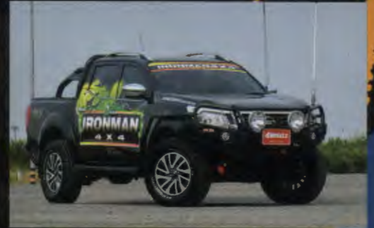
60 แลรถคันรัก นิสสัน เอนพี 300 นาวารา