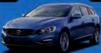
แถมค่าลงทะเบียน

CHEVROLET COLORADO HIGH COUNTRY MY 17 • PEUGEOT EXPERT TEPEE