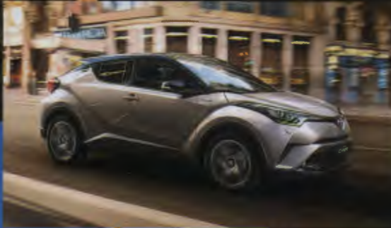
46 รถใหม่ 4x4 โตโยตา ซี-เอชอาร์