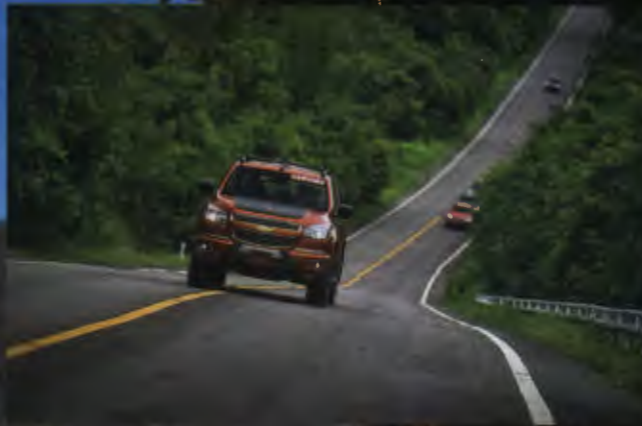
50 ทดลองขับ เชฟโรเลต โคลราโด ไอ คันทรี เอ็มวาย 17