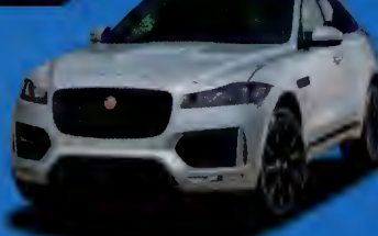
ผลทดสอบต่างแดน