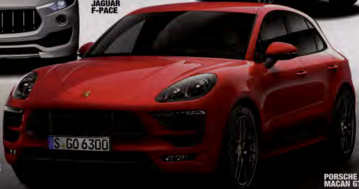
PORSCHE MACAN GTS