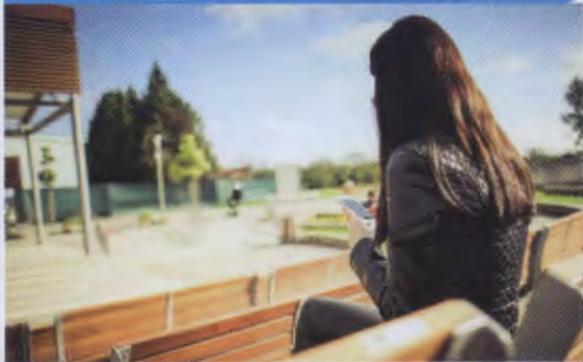
สังคมออนไลน์กับชีวิตการทำงาน