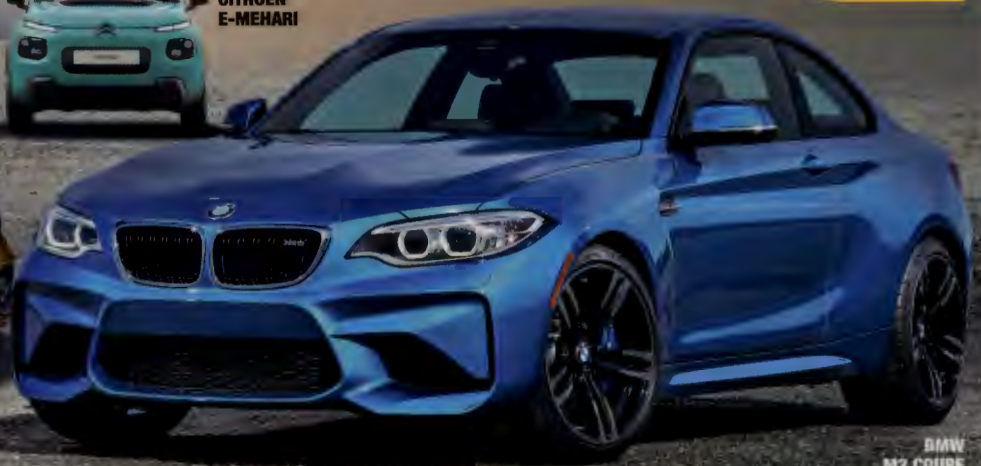
BMW M2 COUPE