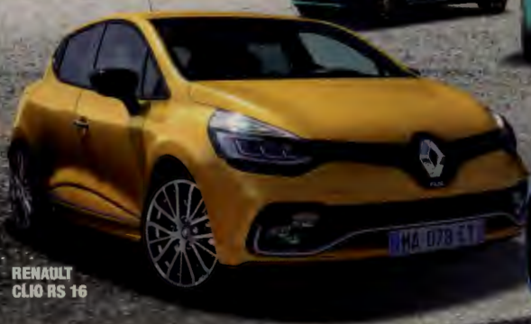
RENAULT CLIO RS 16