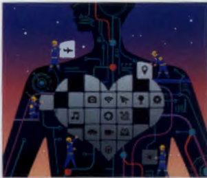
แพลตฟอร์ม IoT หัวใจของข้อมูล P.95