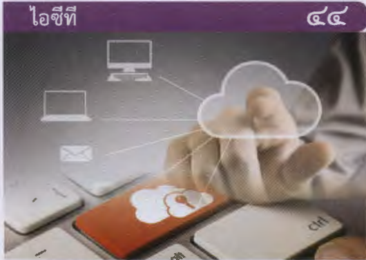
เผย Cloud Computing เรื่องจำเป็นแต่ต้องระวัง