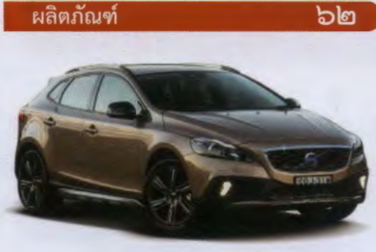
Cross Country ดีเซล Volvo V40 D4

เจ้าของ: บริษัทหนังสือพิมพ์อีคอนนิวส์ จำกัด บรรณาธิการผู้พิมพ์/ผู้โฆษณา: บรรณานิ สุวรรณผ่อง สำนักงาน: ๔๔/๓๐-๓๑ ถนนงามวงศ์วาน แขวงลาดยาว เขตจตุจักร กรุงเทพฯ ๑๐๑๐๐ โทร. ๐-๒๕๕๓-๔๕๐๒-๖ โทรสาร ๐-๒๕๕๓-๔๕๐๑ e-mail: econnews@econnews.org Website: www.econnews.org แม่พิมพ์สีสี่ ขนาด: เลย์โปรเซส