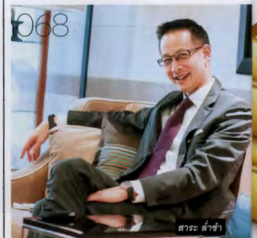
สาระ คำซ้ำ

■ เจาะลึกช่องทางลงทุนในอินโดฯ 5 ปัจจัยหนุนลดตลาดหุ้นจากรัฐฯ เจาะลึกช่องทางการทำธุรกิจสอดรับนโยบายส่งเสริมการลงทุนของรัฐบาล อินโดนีเซีย ทำความรู้จัก 2 หน่วยงานสำคัญและสำรวจพื้นที่เขตเศรษฐกิจใหม่ พร้อมเผยโอกาสการลงทุนผ่านตลาดหุ้นจากรัฐฯ จับตา 5 ปัจจัยหนุนเศรษฐกิจปี 2016