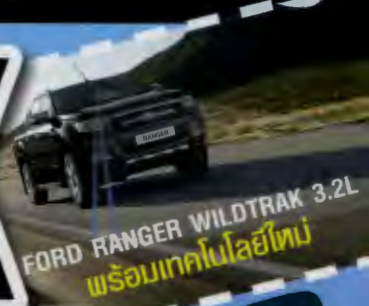
FORD RANGER WILDTRAK 3.2L พร้อมเทคโนโลยีใหม่

กรังด์ปรีซ์ มิตยสารรถยนต์ที่มีผู้อ่านมากที่สุด