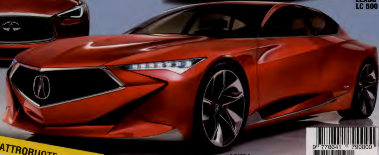
ACURA PRECISION CONCEPT