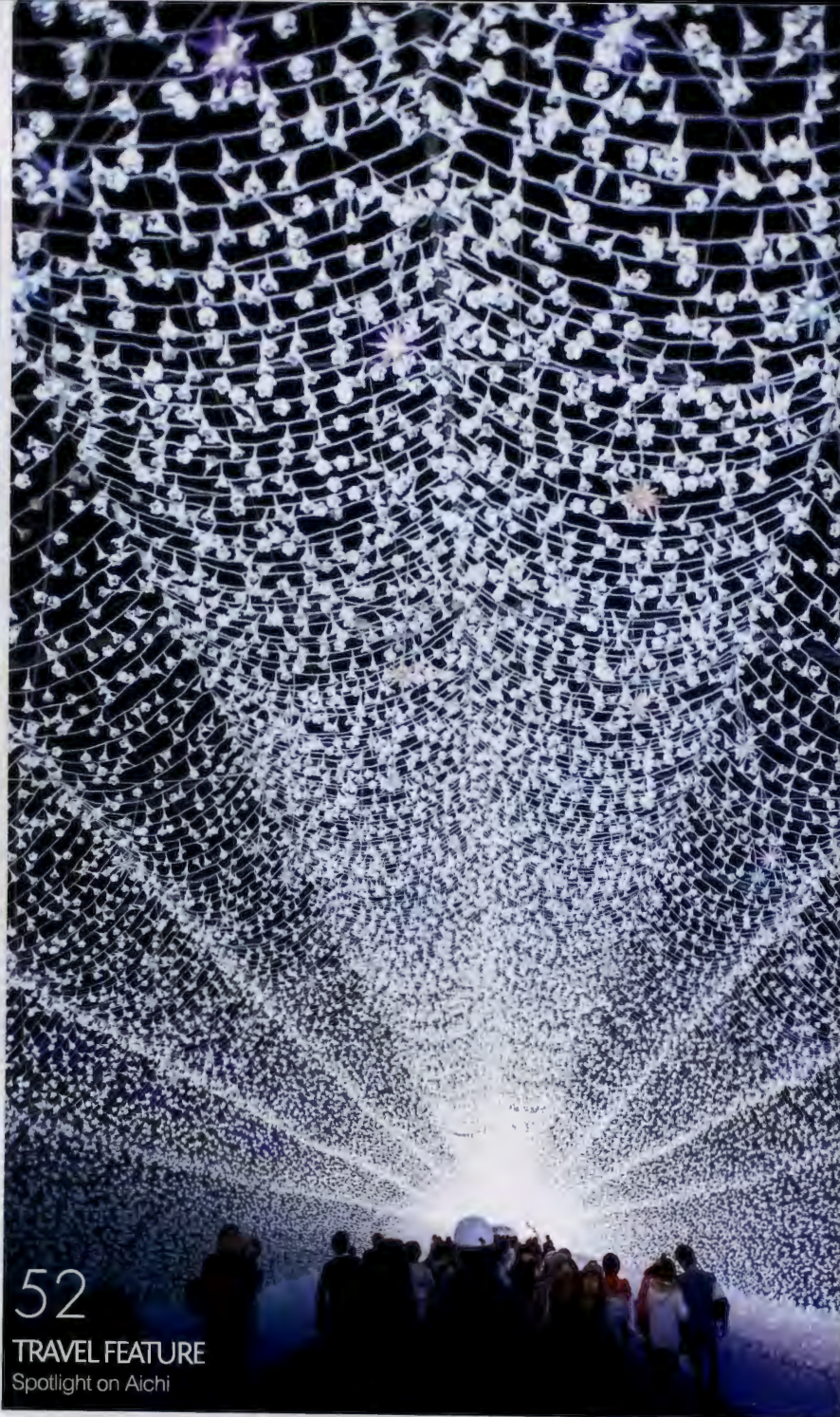
52 TRAVEL FEATURE Spotlight on Aichi