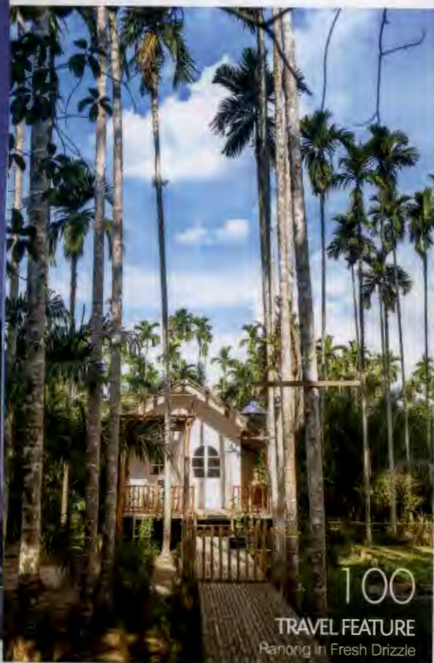
100 TRAVEL FEATURE Panong in Fresh Drizzle