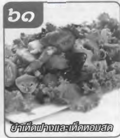
ยาหีดฟางและหีดหอบสด