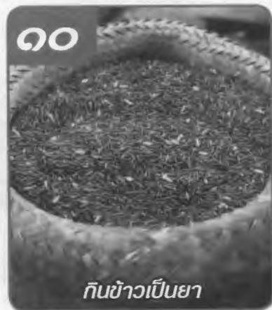
กินข้าวเป็นยา