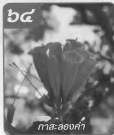
กาสะลองคำ