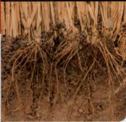
SCIENCE AND THE KING